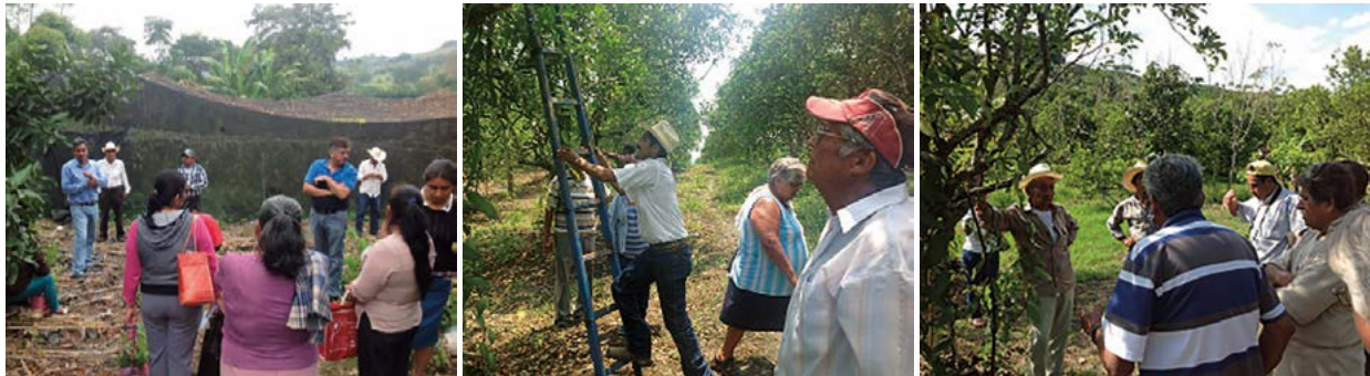
Figura 2. Talleres participativos para transferencia de innovaciones productivas

empresas privadas, y agencias de desarrollo. Las actividades desarrolladas se centraron en la impartición de talleres participativos sobre organización, misión y visión empresarial, cálculo de costos de producción, requisitos para comercializar, el consumo nacional de vainilla, los requerimientos para exportar (Figura 2,3).