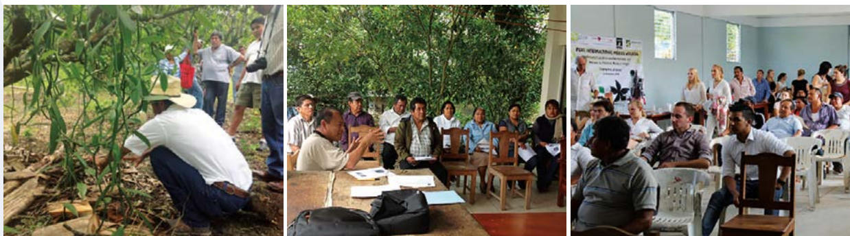
Figura 3. Talleres participativos para transferencia de innovaciones sociales (administrativas, organizativas y de comercialización).