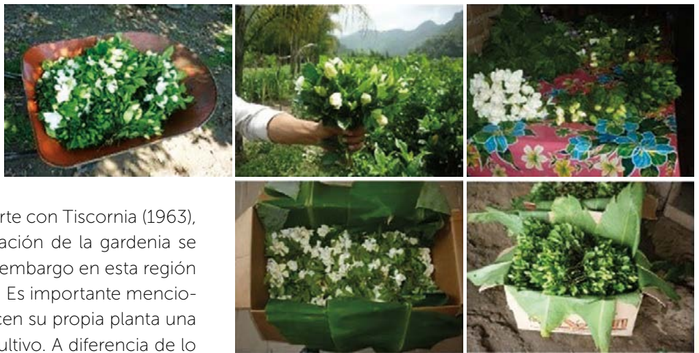
Figura 2. Botón floral de gardenia ( Gardenia jasminoides Ellis).

investigación. Esto puede ser un factor determinante para la calidad y cantidad de producción y que las plantaciones no se estén aprovechando al máximo. La multiplicación biológica se realiza por esquejes y acodado aéreo. Esto coincide en parte con Tiscornia (1963), quien menciona que la propagación de la gardenia se da por esqueje y por injerto, sin embargo en esta región no se utiliza esta última práctica. Es importante mencionar que los encuestados producen su propia planta una vez que tienen establecido su cultivo. A diferencia de lo reportado por Murguía et al. (2008), ahora la técnica de propagación más recurrente es 53% por acodado, el esqueje 28% y 19% no práctica ninguna técnica. El 82% de los productores reportó algún tipo de daño en sus huertas, entre los que resalta el clima, presencia de enfermedades y malezas, ataque de insectos y/o fauna nociva o la combinación de algunos de ellos, esto último es considerado el daño más importante por 65% de los productores. Esto demuestra, de acuerdo a Murguía et al. (2008), que por desconocimiento o falta de información no le dan importancia a que las plantas se vean atacadas por agentes patógenos. Con respecto al grado de severidad de daños ocasionados a sus huertas, 62% reportó tener un grado de severidad bajo y 16% considera que es