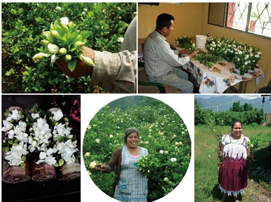
Figura 3. Productos de gardenia ( Gardenia jasminoides Ellis) comercializados en la región central de Veracruz, México.

Con referencia a los precios de los productos de gardenia, se registró diversidad en las regiones encuestadas, resaltando que 60% de los productores encuestados la vende a intermediarios, 19% vende directamente y 21% hace una combinación