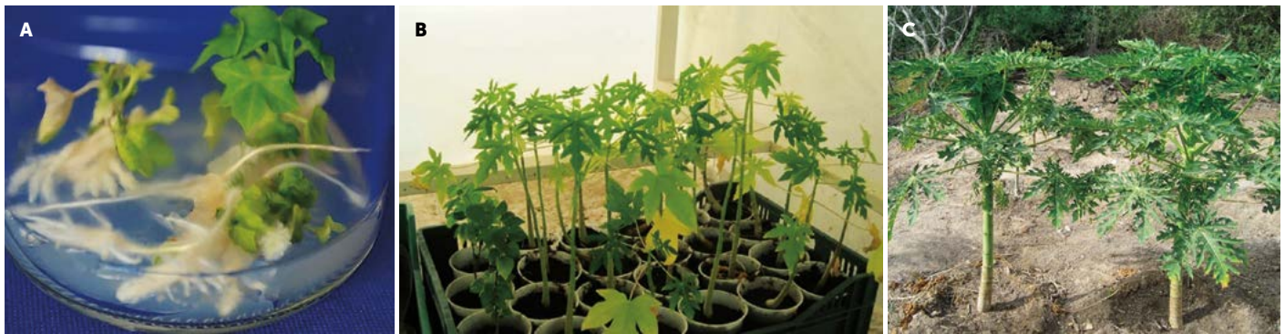
Figura 5. A: Generación de raíces de Carica papaya L., aplicando IBA 3 \mu M. B: adaptación en invernadero. C: Germoplasma ex situ trasplantadas a campo a partir de plántulas in vitro .

identidad y éxito de las accesiones y preservar las características deseables, registrando que una vez establecidas la plantas, el desarrollo fue rápido, logrando propagar el germoplasma de papaya criolla en condiciones in vitro , así como, llevar a cabo su multiplicación en cultivo de tejidos y el desarrollo y mantenimiento ex situ . La colección de germoplasma permite, la reducción de la pérdida de recursos fitogenéticos o erosión genética.