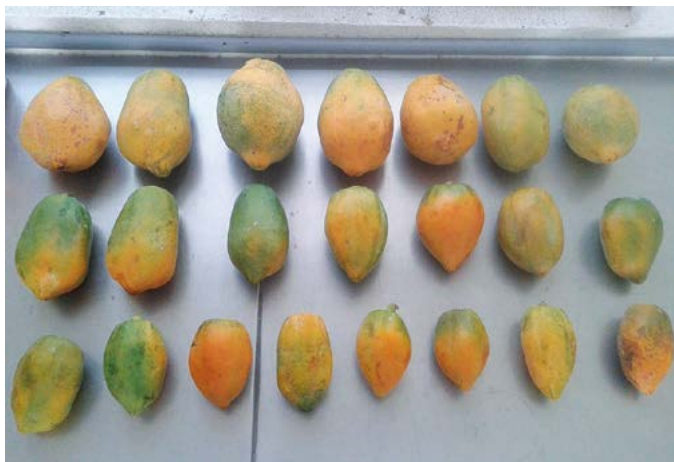
Figura 1. Frutos recolectados de Carica papaya L., procedentes del Ejido #2 de Baja California Sur, México.

lada estéril, se colocaron en medio Murashige-Skoog (MS) con sacarosa al 3% y agar 0.8%. Se mantuvieron en condiciones controladas a 25 \pm 2 °C de temperatura y fotoperiodo de 16 horas de luz por ocho horas de oscuridad. De los frutos maduros se extrajeron semillas, eliminando el arilo y mucilago (Pohlan et al. , 2001). Se secaron a la sombra por 48 horas a temperatura ambiente sobre papel absorbente y posteriormente se almacenaron en sobres de papel (Hernández-Salinas et al. , 2012). Para la introducción in vitro se tomaron semillas de 1 a 2 meses de recolecta, desinfectándolas con hipoclorito de sodio comercial al 30% y se sembraron en frascos de vidrio de 120 ml conteniendo agar al 0.8% bajo condiciones asépticas, incubándolas a 30 \pm 2 °C. A partir de las plántulas desarrolladas in vitro , se tomaron los brotes y se transfirieron a medio MS con ácido nftaleno acético ( 2 \text{ mg L}^{-1} ) y adenina ( 5 \text{ mg L}^{-1} ) (MNA), así como, MS con ácido indolbutírico (IBA, 1 \times 10^{-5} M) y kinetina ( 5 \text{ mg L}^{-1} ) (MIK), y para la inducción del enraizamiento se evaluaron 3 \mu\text{M} de IBA. Se realizaron pruebas de trasplante y acondicionamiento de las plántulas in vitro a maceta en invernadero durante dos meses con riego dos veces por semana. Se mantuvieron a temperatura de 25 \pm 5 °C e iluminación solar. El trasplante definitivo fue en suelo arenoso y condiciones con temperatura media anual de 24 °C y precipitación media anual de 267 mm.