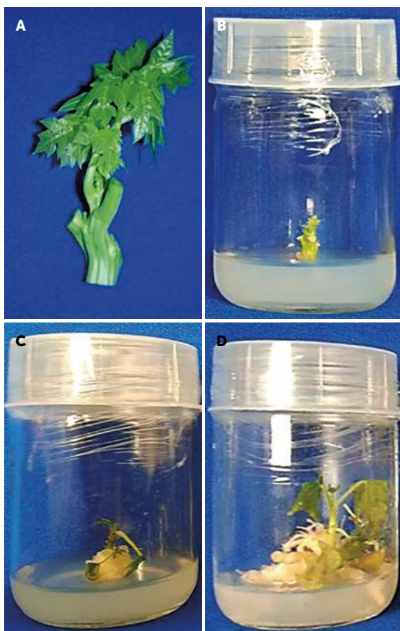
Figura 4. Inducción de brotes de Carica papaya L., a medio Murashige-Skoog (MS) con hormonas para el enraizamiento. A: brote recolectado (apical), B: brote en MS una vez desinfectado, C: callo, D: enraizamiento en brote.