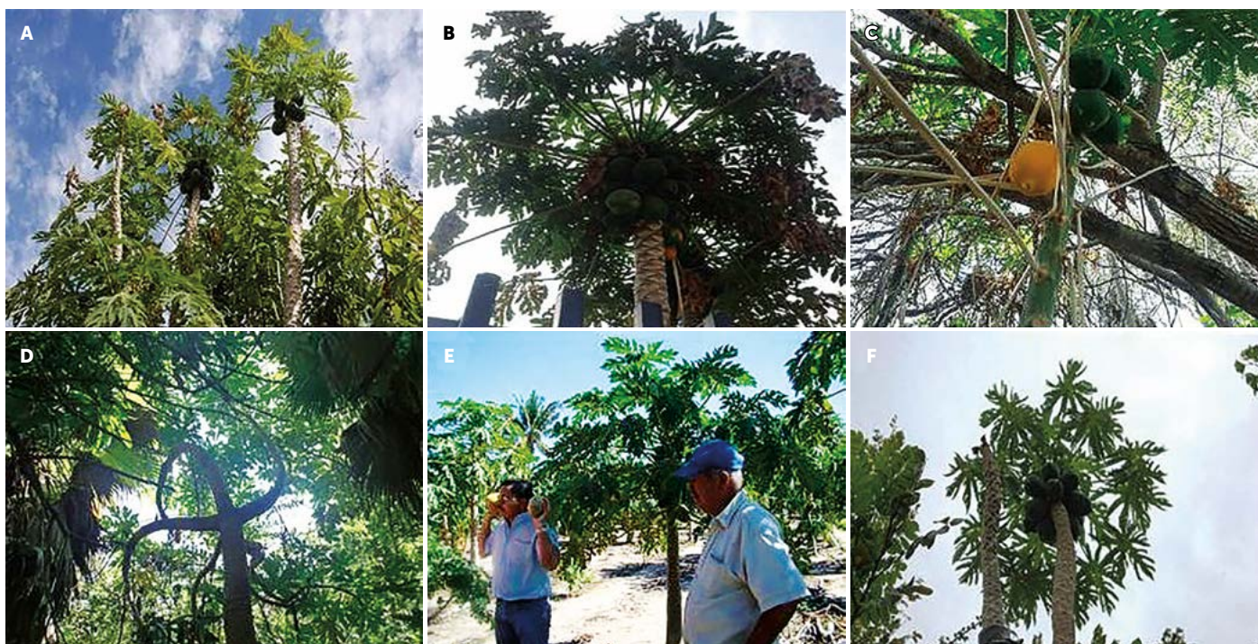
Figura 3. Sitios de recolecta en Baja California Sur: A: San Javier, B: La Paz, C: El Comitán, D: San Bartolo, E: Ejido #2, F: San Miguel de Comondú.