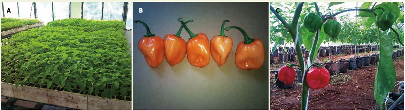
Figura 3. A: Plántula, B-C: Frutos fisiológicamente maduros cosechados y en planta madre de chile habanero ( Capsicum chinense Jacq.)