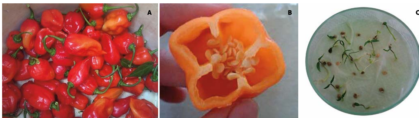
Figura 1. A: Frutos en madurez fisiológica de ( Capsicum chinense Jacq.). B: Extracción de semillas. C: Pruebas de viabilidad.

El trabajo se realizó en el Laboratorio de Biotecnología y Fisiología Vegetal del Instituto Tecnológico de Conkal, Yucatán, México, ubicado en el km 16.3 antigua carretera Mérida-Motul. Se utilizó semilla de chile habanero ( Capsicum chinense Jacq.) variedad "Jaguar" producidas bajo condiciones de invernadero ciclo primavera-verano 2011 en Motul, Yucatán. Se etiquetaron 300 flores durante la antesis de los cuales se cosecharon 120 frutos a los 20, 28, 36, 44 y 52 días después de la antesis (DDA). Al momento de extraer la semilla, se determinó su contenido de humedad tomando muestras de 1 g con tres repeticiones registrando este dato como peso fresco; posteriormente se colocaron en cajas Petri destapadas e introdujeron en una estufa (Fisher Scientific Isotemp®) durante 72 h a 70 \pm 2 °C. Después del periodo de secado se pesaron para registrar el peso seco de cada uno, utilizando la fórmula de Bewley y Black (1994). Las semillas restantes de cada momento de cosecha, se dividieron en tres lotes similares de 9 g, y a cada uno se aplicó un tratamiento de desecación: semilla sin secar las cuales se pusieron a germinar al