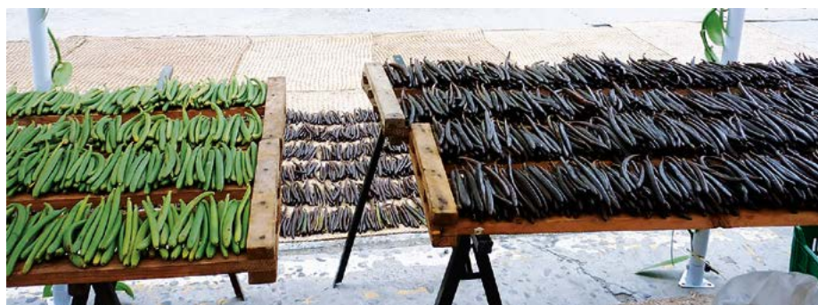
Figura 3. Frutos de Vanilla planifolia Jacks. ex Andrews, y de diferentes localidades de Puebla y Veracruz, México; verdes y sometidas a distintos esquemas de beneficiado.