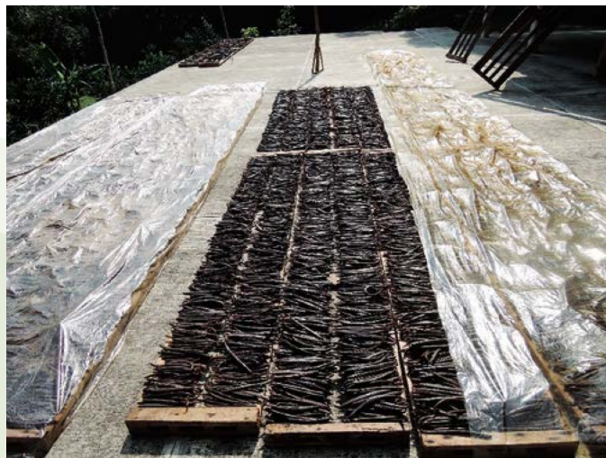
Figura 1. Beneficiado tradicional del fruto de Vanilla planifolia Jacks. ex Andrews.