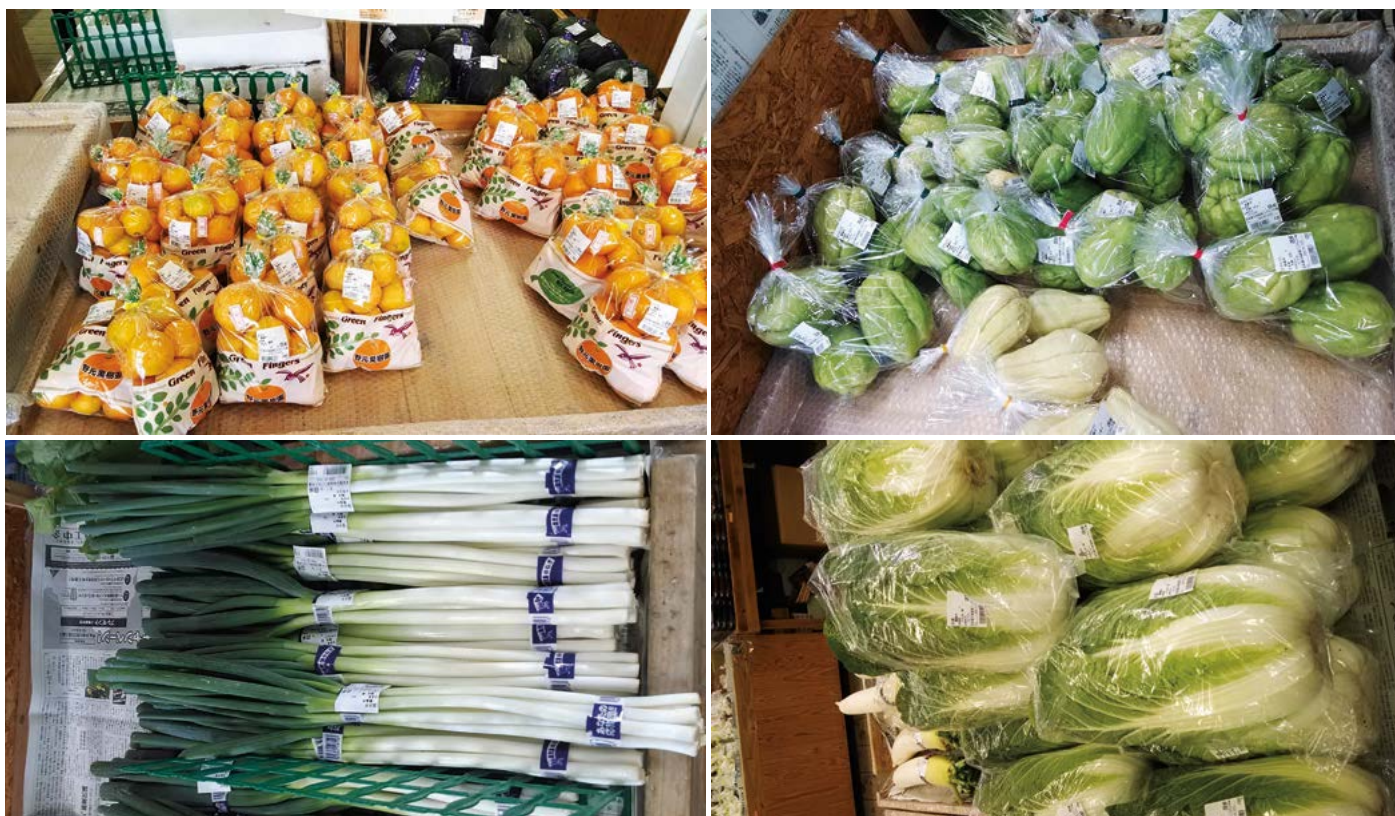
Figura 4. Hortalizas "orgánicas" en condiciones de mercadeo justo: del productor al consumidor.