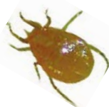
Cuadro 3. Costo total de producción, de control de plagas y de aplicación de acaricidas por tipo de productor en papayo ( Carica papaya ) en el Centro de Veracruz.