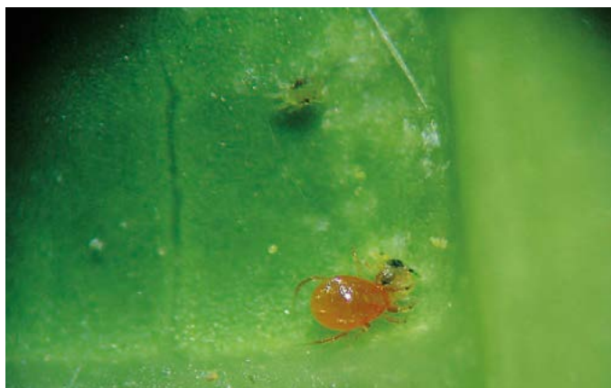
Figura 2. Ácaro adulto Phytoseiulus persimilis , depredando sobre ninfas de tetraniquidos en papayo ( Carica papaya ).

cercano a $5,000 pesos por hectárea, según la especie y presentación del producto, considerando que la dosis mínima recomendada en frutales es de 60,000 depredadores por hectárea. La producción de un organismo de control biológico requiere de instalaciones adecuadas, tal y como lo especifica la Organización de Protección de las Plantas (NAPPO, 2004). Además, deben realizarse procesos meticulosos, que incluyen el transporte y la aplicación del producto. Lo que motivó a evaluar la viabilidad técnica y económica de establecer un Centro de Reproducción Masiva de P. persimilis (CEREMAPP) cercano a la zona productora de papayo del estado de Veracruz.