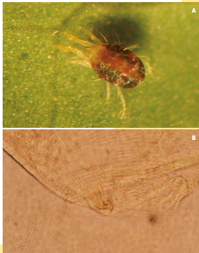
Figura 1. Ácaro plaga del papayo ( Carica papaya ), A: Adulto de Tetranychus merganser , B: Edeago de T. merganser .

Autores como Reyes (2012) han demostrado que el ácaro depredador Phytoseiulus persimilis , obtenido comercialmente, se alimenta de todos los estados de desarrollo de T. merganser (Figura 1), aunque sus parámetros poblacionales indican que no se establecerá en la huerta si se alimenta únicamente de este ácaro. Este depredador puede utilizarse como control biológico de ácaros del papayo por inundación, cuando las poblaciones de depredadores naturales no estén en los niveles poblacionales adecuados. Para que el control biológico pueda ser la base del manejo de ácaros plaga en esta región, debe ser eficiente y a costos competitivos (Romo et al., 2007). Actualmente todos los ácaros depredadores comerciales utilizados en México, incluyendo P. persimilis (Figura 2), son importados de Holanda y EUA, a un costo