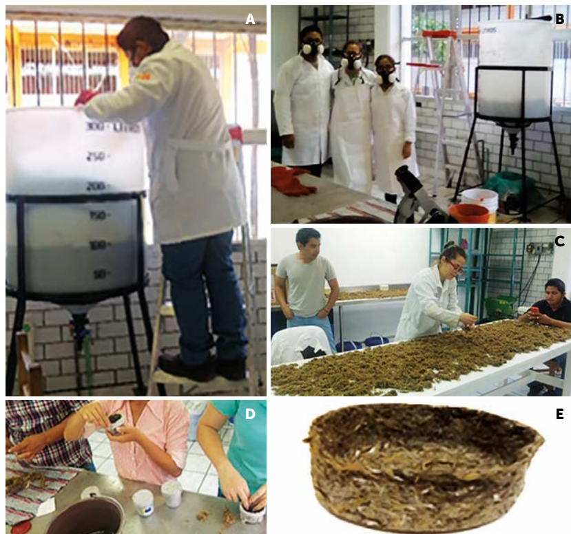
Figura 2. Pretratamiento de la fibra de paja de caña de azúcar en las instalaciones de la Universidad popular de la Chontalpa (UPCH).

Una vez seca la fibra pretratada se colocó dentro de un reactor de 50 L que contenía una solución de H_2SO_4 al 0.4 % (Figura 3A), con el fin de remover las regiones amorfas de la celulosa. Posteriormente, la mezcla se sometió a ebullición durante una hora. Transcurrido el tiempo se procedió a lavar la fibra hasta obtener un pH de 7.0.