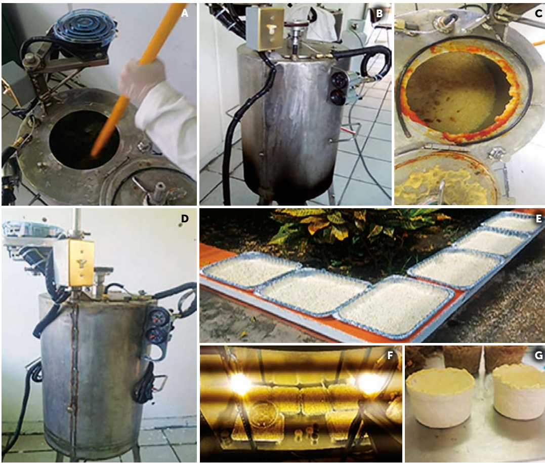
Figura 3. Tratamiento de la paja de Saccharum spp. para obtención de material celulósico usado en la elaboración de recipientes biodegradables. A: Hidrólisis ácida. B: Cloración. C: Extracción alcalina. D: Blanqueo. E: Secado solar. F: Secado en cámara. G: Prototipos de recipientes de celulosa.

temperatura ambiente y a la sombra durante dos días (Figura 3E). Adicionalmente se dejó un día en la cámara de secado a 60 °C (Figura 3F). Los recipientes de celulosa (Figura 3G) fueron hechos con la fibra húmeda y pH neutro al término del tratamiento, utilizando un molde de plástico y un peso de cemento; los prototipos se dejaron en la cámara de secado a 60 °C durante 72 h.