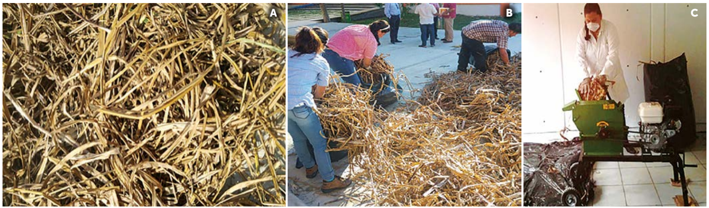
Figura 1. Procesamiento de paja de caña de azúcar para obtención de celulosa. A: Secado. B: Seleccionado. C: picado.

fue adaptada para la muestra de paja de caña, con el fin de eliminar ceras, pectinas y resinas presentes en la fibra.