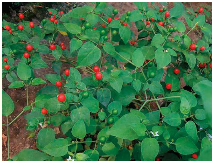
Figura 3. Chile piquín del noreste de México.

Piquín Huasteco. Su distribución se ubica en toda la zona Huasteca, desde el nivel del mar hasta los 400 m; las mayores poblaciones de este subtipo se encuentran en siembras de traspatio y pequeñas áreas en "milpas" asociado con maíz o como cultivo solo. También se le puede encontrar en