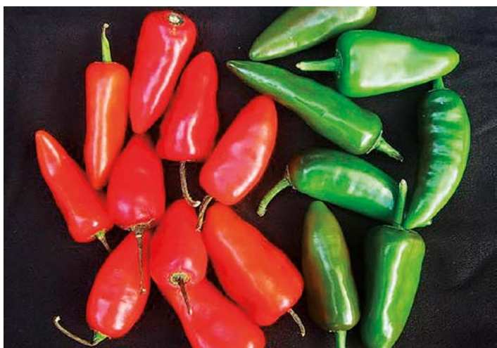
Figura 7. Chile mirador.