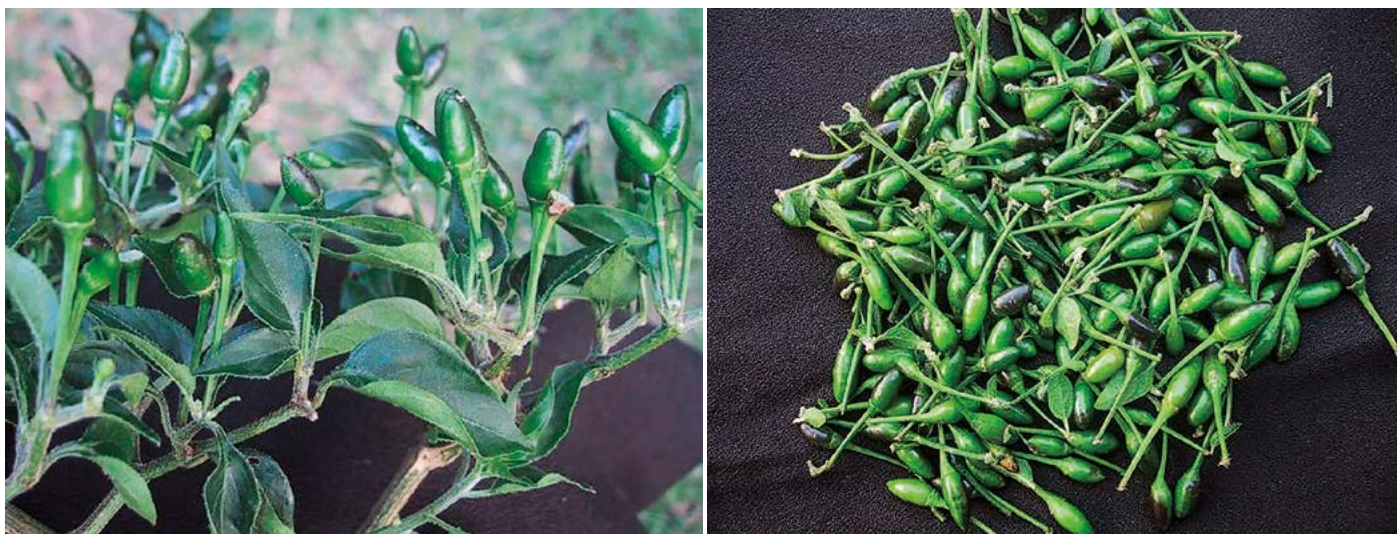
Figura 4 Chile piquín huasteco, uno de los tipos de chile semidomesticado más importante de la zona Huasteca.

550 m. Presenta plantas compactas de 60 a 80 cm de altura y cobertura de follaje de 45 a 50 cm; sus hojas presentan pubescencia moderada a intensa. Sus frutos pueden estar en posición pendiente y/o erecta, son de forma cónica a cónica alargada y de color verde claro a verde esmeralda que cambia a rojo oscuro en madurez total. Los frutos del chile pico de paloma tienen una longitud de 1.0 a 2.5 cm y diámetro de 0.8 a 1.2 cm (Figura 6). Generalmente se comercializa como fruto maduro seco.