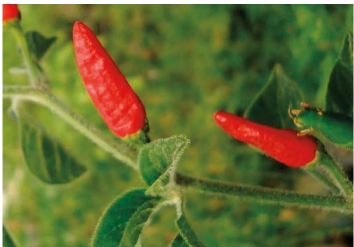
Figura 8. Chile pico de pájaro.