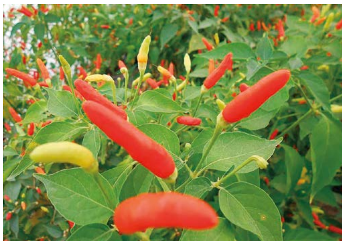
Figura 5 Chile chilpaya.

Rayado. Es un subtipo de jalapeño que se distribuye en pequeñas plantaciones ubicadas en altitudes de 100 a 1200 m, como cultivo único. Sus plantas son de porte compacto de 40 a 90 cm de altura y follaje con pubescencia intermedia a abundante. El nombre de este subtipo de chile se debe al grado de acorchado de su pericarpio, que en la mayoría de los casos supera el 90% (Figura 9). Sus frutos son grandes, con una longitud mayor a 8 cm y un diámetro de 2.4 a 4.2 cm, lo que le da un peso que fluctúa de 35 a 60 g por fruto. Su comercialización se realiza en estado verde