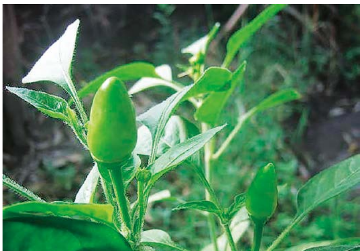
Figura 6. Chile pico de paloma.