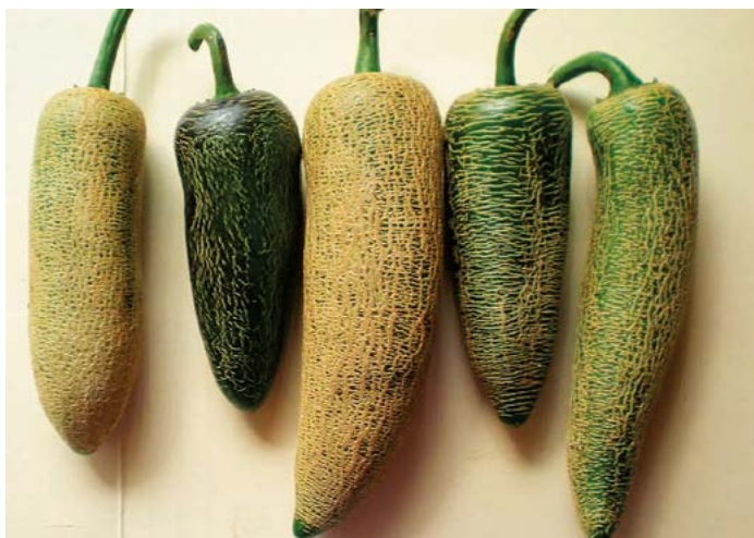
Figura 9. Variabilidad en chile rayado.