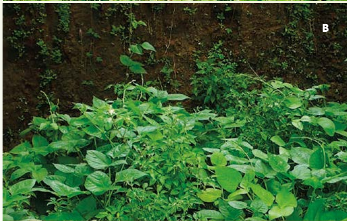
Figura 2. A: Planta de chile piquín. B: Tipos de chile semidomesticado en condiciones de selva baja en la zona Huasteca, en México.