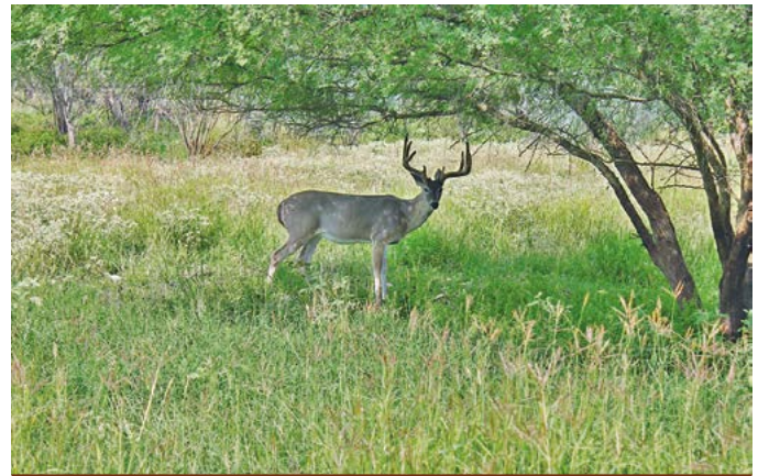
Figura 3. Venado cola blanca ( Odocoileus virginianus ) en instalaciones del Centro de Mejoramiento Genético Linares, Nuevo León, México.

En general, en el presente estudio se identificó que el MET tiene una producción total de biomasa disponible de 2.694 \text{t ha}^{-1} \text{año}^{-1} , con 673.5 \text{kg ha}^{-1} por época, similar a lo reportados por Heiseke (1984), con valores de 2.68 \text{t ha}^{-1} \text{año}^{-1} para un área de Linares, Nuevo León, México, pero menor a lo citado por Reséndiz (2012) (2.88 \text{t ha}^{-1} \text{año}^{-1} ) y cercano a lo registrado por Olguín (2005) en la misma vegetación en el área de Tamaulipas con 4.21 \text{t ha}^{-1} \text{año}^{-1} . Lo anterior fue atribuible a que la