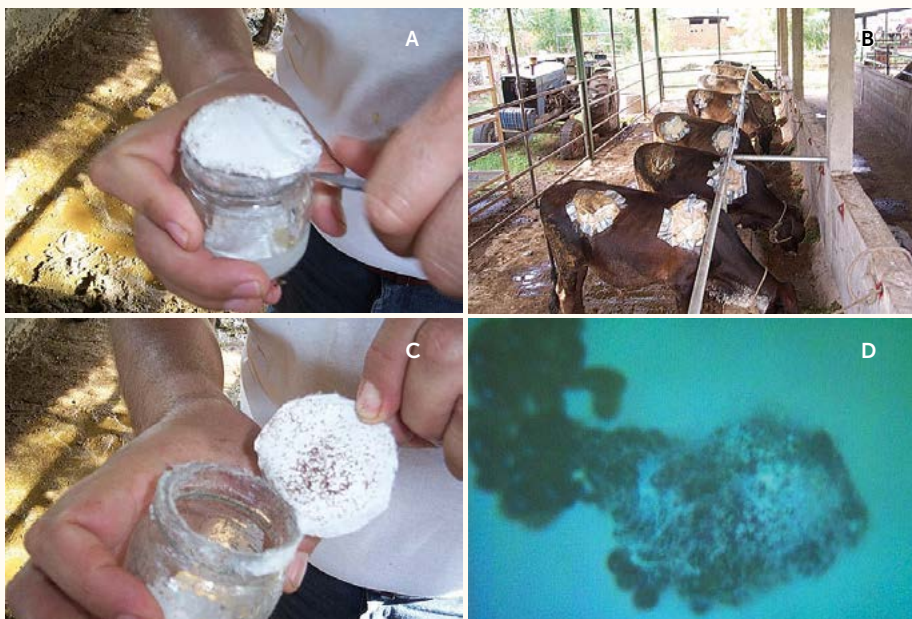
Figura 1. A: Aplicación de larva (L1) de Bophillus spp., en bovinos. B: Terneros sometidos a la prueba de respuesta animal. C: Frascos conteniendo L1 de Bophillus spp., 4000 por unidad. D: Huevos de larva (L1) invadidos por el micelio de Metarhizium anisopliae .

Se determinó efectuando un conteo previo a la aplicación de los tratamientos y luego cada 24 horas por cinco días para establecer el número de garrapatas adultas muertas y vivas que aún se hospedaban en cada cámara. El porcentaje de eficiencia de los productos