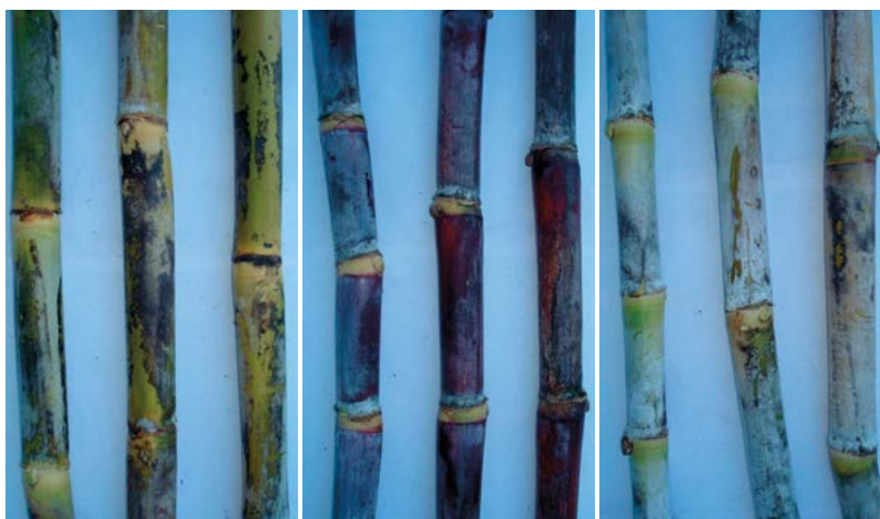
Figura 4. Diferencias de entrenudos entre distintas variedades de caña de azúcar.

de los híbridos desde etapas tempranas, y colocarlos como sobresalientes, momento en que se pueden realizar las multiplicaciones in vitro de estos materiales. Sin embargo, debido a la falta de un análisis estadístico riguroso en estas fases, dichos materiales no puedan pasar a las fases subsecuentes, lo que implica mayores gastos y periodos más largos de selección. El cultivo in vitro también permite compartir materiales entre centros de investigación que contribuyen a la selección de los híbridos en otros ambientes, lo que garantiza la pureza genética y sanidad, además de abaratar los costos de envío del material en comparación con la forma convencional (dos estacas con tres yemas viables), con lo cual en muchos de los casos no se logra establecer la variedad o se cuenta con apenas una sola planta para su establecimiento. Este método de multiplicación, permite hacer evaluación a factores bióticos y abióticos, pudiendo acortar los tiempos de selección