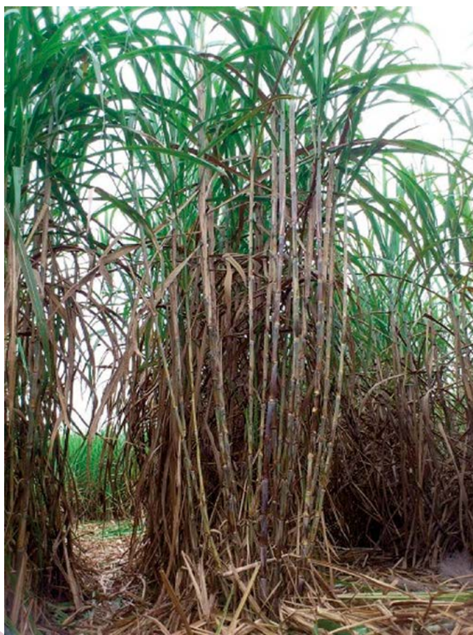
Figura 3. Variedades con alto potencial productivo desarrolladas en el Colegio de Postgraduados (COLPOSCTMEX 05-204).

Si bien los rendimientos que se han obtenido con el esquema tradicional de mejoramiento genético han aumentado, el crecimiento anual ha sido de tan solo 0.4%. Comparativamente con Brasil, los incrementos anuales han sido de 1.5% (Waclawovsky et al. , 2010), lo que indica que las ganancias observadas en México aún son precarias. Para lograr avances sustanciales en la generación de nuevas variedades de caña de azúcar (Figura 3) que impacten de manera significativa el sistema de producción, es necesario implementar diferentes estrategias de innovación (cambio basado en el conocimiento que genera valor) a través del uso de nuevas tecnologías adaptadas a las condiciones propias en cada ambiente productivo de caña, teniendo en cuenta la sustentabilidad del sistema. Aplicaciones biotecnológicas como el cultivo in vitro de plantas para la propagación de materiales libres de enfermedades, y de alta calidad, uso de modelos estadísticos multivariados para la evaluación y selección de híbridos de nuevas generaciones, y avances en el conocimiento del genoma del género Saccharum , son algunos de los enfoques que se abordan.