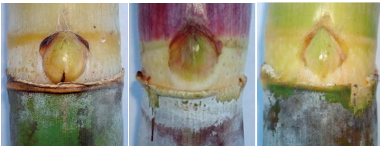
Figura 5. Diferencias en tipos de yemas entre distintas variedades de caña de azúcar.

y liberar más variedades para cubrir la demanda del sector (Snyman et al. , 2011).