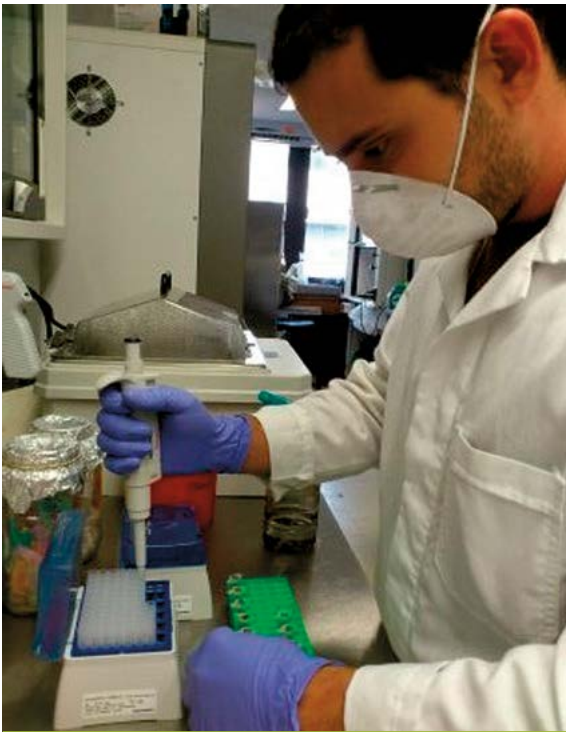
Figura 7. Extracción de DNA genómico de caña de azúcar para diversos estudios en biotecnología. (Foto: M. C. Héctor Emmanuel Senties Herrera).

de biomasa per se , los nuevos enfoques visualizan a este cultivo como una de las biofábricas innovadoras del futuro, principalmente para la producción de bioplásticos, proteínas de uso farmacológico y azúcares (Waclawovsky et al. , 2010; Aguilar-Rivera et al. , 2012; Gómez-Merino et al. , 2014).