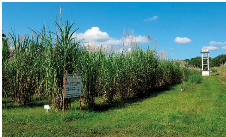
Figura 1. Banco de germoplasma del Centro de Investigación y Desarrollo de la Caña de Azúcar (CIDCA).

superficie sembrada del país; el 45% restante se encuentra sembrado con variedades extranjeras, gracias al Programa de Intercambio e Importación de Variedades que mantiene la Cámara Nacional de las Industrias Alcohólica y Azucarera (CIDCA, 2013) (Figura 1).