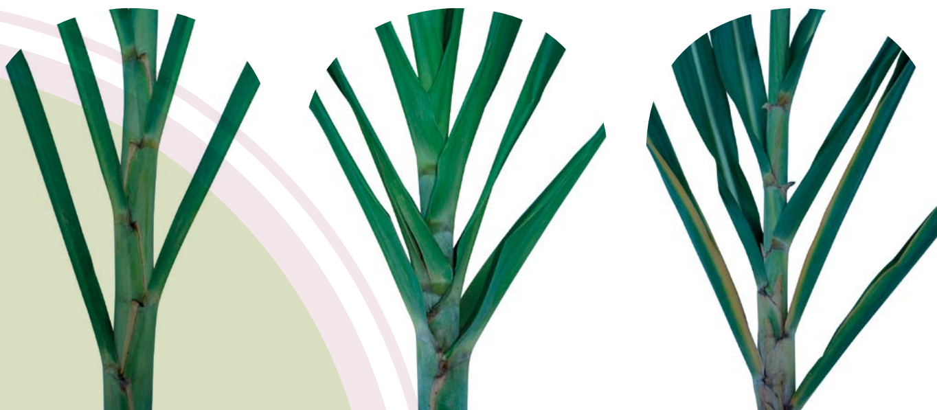
Figura 6. Diferencias en tipos de hojas entre distintas variedades de caña de azúcar.

La manipulación de genes en caña ha tenido importantes progresos, y a nivel experimental se ha avanzado en el desarrollo de resistencia al ataque de insectos, inmunidad a enfermedades, tolerancia a factores adversos como sequía, heladas, anoxia e hipoxia (Stepanova et al. , 2002; Filippone et al. , 2010; Srivastava et al. , 2012; Thiebaut et al. , 2012; Dedemo et al. , 2013). Además de los proyectos tendientes a elevar la síntesis de sacarosa, bioetanol y la producción