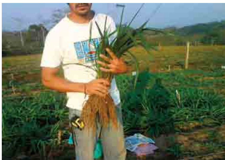
Figura 3. Corte de plantas en forma extractiva para determinación de biomasa.

La colonización del sistema radical de ambas especies fue muy semejante al final de la evaluación (Figura 4 A), lo cual confirmó la alta cantidad de esporas encontradas en el mismo