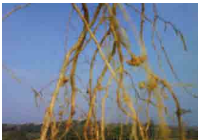
Figura 2. Sistema radical de Clitoria ternatea con presencia de nódulos.

aplicados en B. brizantha , superaron al testigo y fueron estadísticamente superiores, mientras que en C. ternatea la producción más alta se logró con el tratamiento biofertilizado con R. intraradices . Este resultado evidencia la importancia de los microorganismos en el sistema radical de las plantas, que seguramente favorecen la acumulación de reservas (carbohidratos) para ser utilizadas después del corte y favorecer el rebrote. Es importante considerar que el rebrote de las especies forrajeras se produce mediante el transporte de carbohidratos no estructurales de la base del tallo y raíces a los meristemos aéreos remanentes, después de realizada la defoliación (Hernández y Ramírez, 1986); los cortes frecuentes o pastoreo severo disminuyen considerablemente la disponibilidad de carbohidratos y ocasionan baja tasa de rebrote.