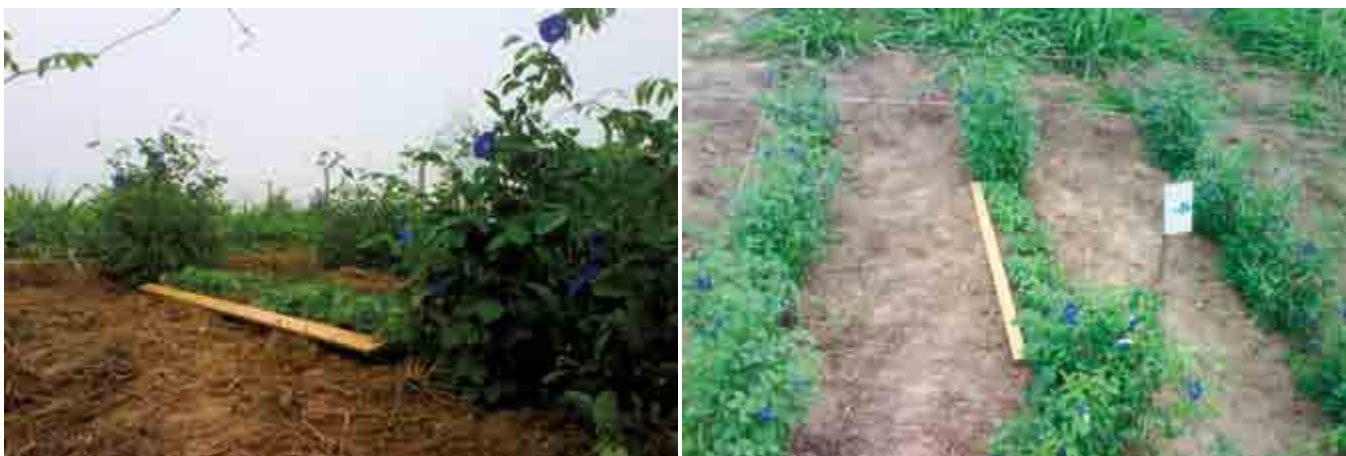
Figura 1. Distribución de parcelas experimentales de dos especies forrajeras.

brasile , o cuando se aplicaron los dos microorganismos juntos. En este caso se encontraron diferencias estadísticas significativas entre tratamientos a favor de los biofertilizantes. La inducción del desarrollo vegetal del Brachiaria biofertilizado con A. brasilense ha sido documentada por Riess y Savito (1985), y la mayor asignación de materia seca cuando se biofertiliza con R. intraradices ha sido reportada en otros cultivos, como frijol ( Phaseolus vulgaris ) por Aguirre-Medina y Kohashi (2002), y maíz ( Zea mays ) por Irizar et al. (2003).