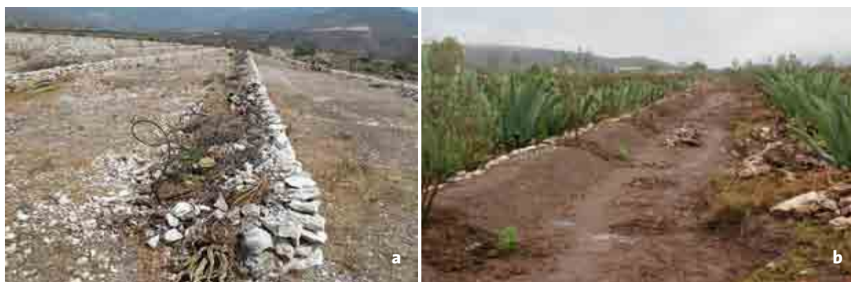
Figura 7. Sistema de barreras de piedra para el establecimiento de huertas de olivo ( Olea europaea L.) (a). Huerta de olivo asociada con el cultivo de maguey (b).