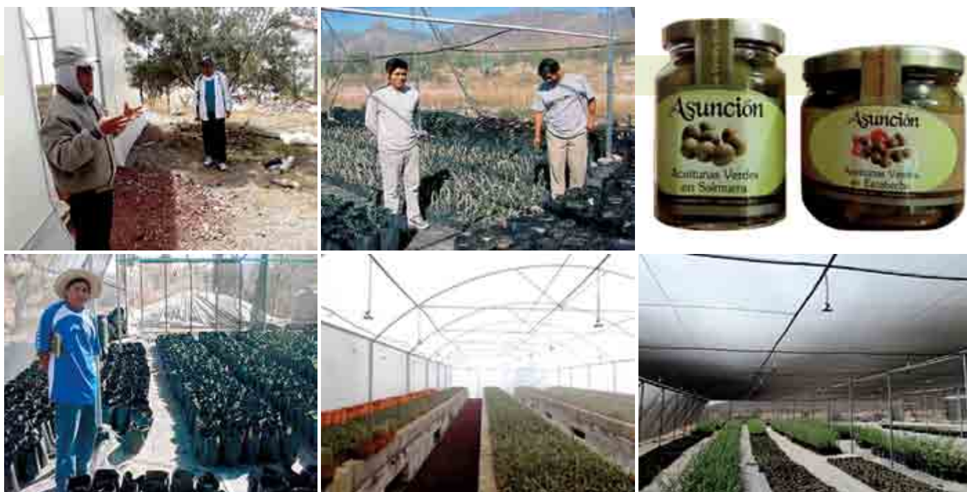
Figura 12. Viveros de plantas de olivo ( Olea europea L.) para venta, ubicadas en la comunidad “El Olivo”, Ixmiquilpan, Hidalgo