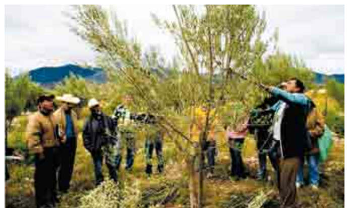
Figura 9. Poda de ramas de olivo ( Olea europaea L.) en árboles de dos años.

ingresos a la comunidad y reducir la migración. De igual forma, la Sociedad de Producción “Unión Alberquina” se ha organizado para realizar labores similares y comercializa sus productos bajo la marca “Asunción”. En esta comunidad se lleva a cabo la feria anual del olivo, donde se comparte la tecnología agrícola desarrollada para el establecimiento, mantenimiento y venta de productos de este cultivo (Figura 12).