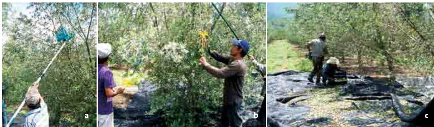
Figura 4. Labores durante la cosecha de aceituna. Uso de cepillos para tirar las aceitunas de las ramas más altas (a); peinado manual de frutos (b) y colecta de aceitunas en lonas de plástico (c) en Tula, Tamaulipas.

México; para esto se publicó un estudio diagnóstico de la Comisión Nacional de Fruticultura (CONAFRUT) que presentaba los requerimientos ecológicos y las zonas del país más adecuadas para este cultivo (Romero, 1975). En 2010 la superficie plantada de olivo se estimó en 8,928 ha, de las cuales 6,817 se encontraban en etapa productiva, produciendo 27,209 toneladas con un valor de 187.3 millones de pesos (SIAP, 2011). Sin embargo, para 2011 la cosecha fue de menos de la cuarta parte de lo producido en 2010, lo que muestra la falta de estabilidad en la producción (Grijalva et al. , 2009). En Tula, Tamaulipas, con inversión mexicana y española, en 2003 se plantaron dos mil hectáreas de olivos de las variedades Arbequina, Hojiblanca, Picual, Manzanilla, Arbozana y Koroneiky, mismas que han generado más de mil jornales (empleo local rural) para la cosecha de cinco mil toneladas de aceituna, y se cuenta con una planta procesadora o almazara con capacidad de 750,000 L -1 de aceite (Figuras 4 y 5).