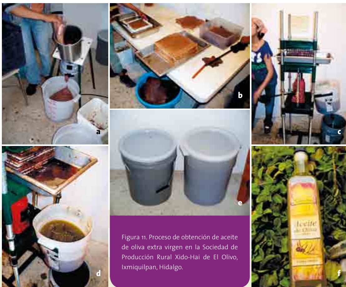
Figura 11. Proceso de obtención de aceite de oliva extra virgen en la Sociedad de Producción Rural Xido-Hai de El Olivo, Ixmiquilpan, Hidalgo.