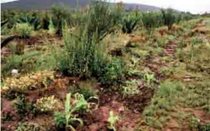
Figura 8. Asociación de olivo con cultivos de maíz ( Zea mays ), frijol ( Phaseolus vulgaris ) granadas ( Punica granatum ), higos ( Ficus carica ), duraznos ( Prunus persica ) y elementos de la flora nativa del Valle del Mezquital.