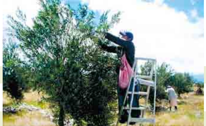
Figura 10. El cultivo de olivo ( Olea europaea L.) ocupa mano de obra familiar.