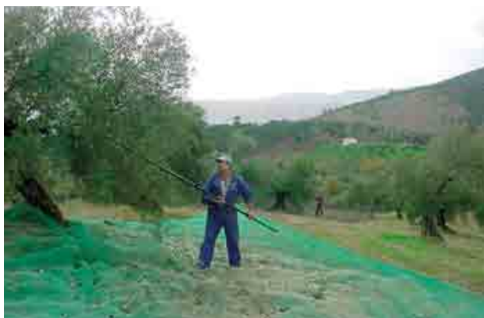
Figura 3. Cosecha de aceitunas en el Valle de Los Pedroches, Córdoba, Andalucía, España.

más, en 1777 se expidió una nueva cédula, ordenando la destrucción de todos los olivos existentes en estas tierras, por lo que la mayoría fueron desarraigados (Delfín, 2004). Actualmente se pueden encontrar árboles de olivo centenarios en Tulyehualco y Texcoco, Estado de México, que datan de los siglos XVI al XVII. Indudablemente, esta decisión de eliminar el olivo influyó en el estancamiento de la producción en México (Delfín, 2004).