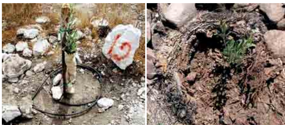
Figura 6. Sistemas de plantación del olivo en cepas nuevas y de plantas de maguey ( Agave spp. ) cosechadas.

Sánchez (2012) reportó 225 especies de plantas asociadas a los cultivos de olivo en esta comunidad, entre las cuales se encontraron especies nativas útiles aprovechadas como cercos vivos ( Lophocereus marginatus y Cylindropuntia kleiniae ), para cobertura de suelo y formadoras del mismo ( Karwinskia humboldtiana y Flourensia resinosa ), medicinales