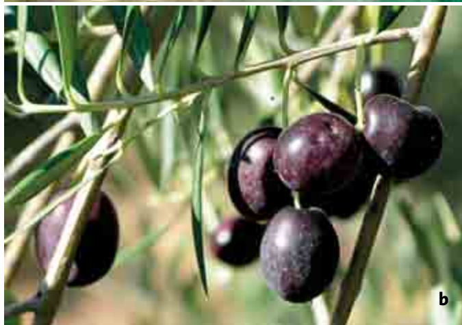
Figura 1. Árbol centenario de olivo ( Olea europaea L.) en Huexotla, Texcoco, Estado de México (a) y drupas maduras (aceitunas) (b).