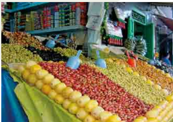
Figura 2. Venta de aceitunas en el mercado de Tetuán, Marruecos

El origen del olivo se remonta a la región geográfica que abarca desde el sur del Cáucaso hasta las altiplanicies de Irán. El clima mediterráneo es propicio para su cultivo y, actualmente, la producción se concentra en regiones ubicadas entre los 30° y 45° LN y LS, de ahí que 95% de la producción mundial de aceite de oliva proceda de la cuenca mediterránea (Mayorga, 2001).