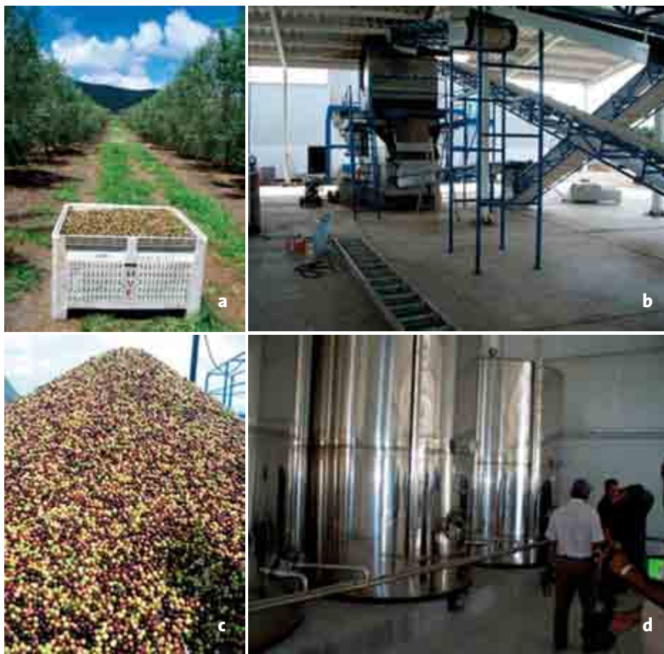
Figura 5. Manejo postcosecha de las aceitunas. Contenedores con la cosecha por cada hilera de olivos (a y b); almazara, lugar de procesamiento de las aceitunas (c); Tanques de almacenamiento temporal de aceite (d) en Tula, Tamaulipas.