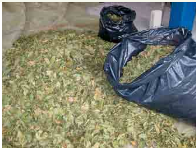
Figura 2. Guásimo ( Guazuma ulmifolia ) seco para ser incluido como ingrediente base en la dieta para borregos.

portado que el consumo de plantas que contienen taninos pueden afectar el funcionamiento digestivo (Hagerman et al. , 1992), afectando la salud y la producción del animal; en muchos casos pueden causar toxicidad (Smith et al. , 2005) e incluso la muerte. Sin embargo, los taninos en bajas cantidades tienen efectos benéficos, como es la protección de la proteína, provocando que ésta sea de sobrepaso y escape a la degradación ruminal, aumentando así la eficiencia de la digestión de la proteína. Por lo tanto, es importante establecer las concentraciones óptimas de taninos en la dieta para mejorar el desempeño en la producción animal (Figura 3).