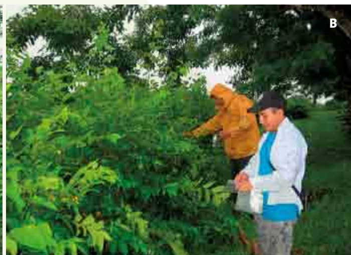
Figura 3. A: Muestreo de follaje de cocoite ( Gliricidia sepium ). B: guásimo ( Guazuma ulmifolia ) para su análisis químico en laboratorio.