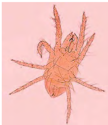
Figura 9. Ácaro ( Eotetranychus lewisi ) alojándose sobre nervaduras centrales de hoja de chayote. Fotografía de una preparación permanente en microscopio compuesto a 16X.