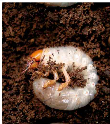
Figura 5. Larva y adulto de "gallina ciega" ( Phyllophaga spp.)