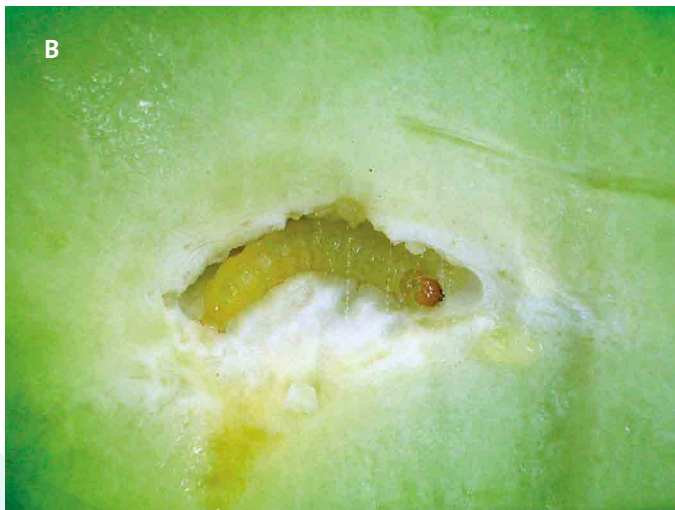
Figura 15. A: Larva de Diaphania nitidalis con desarrollo de 1 ero -4 to instar con puntos negros sobre el cuerpo. B: Larva de 5 to estadio sin puntos negros.