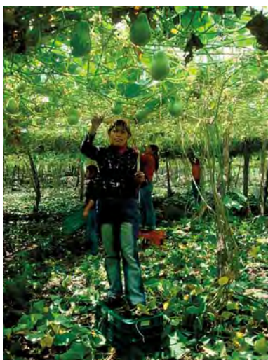
Figura 12. Poda y deshoje de plantas de chayote ( Sechium edule ) en huertas comerciales.