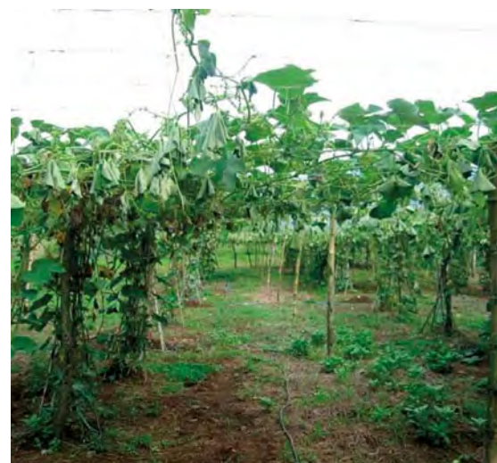
Figura 6. Deshidratación permanente de una planta de chayote provocada por el ataque de la gallina ciega en la zona de raíces.

Control cultural: Incorporación de abonos composteados y deposición de materia orgánica sobre las “calles de la chayotera”, esta práctica ayuda a disminuir el riesgo de infestación por la atracción de las plagas del suelo a zonas de pasillos, alejándolas del área principal de raíces. Si la plaga ya se encuentra en las raíces, es ne-