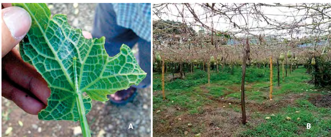
Figura 18. A: Defoliación causada por Diaphania hyalinata . B: Defoliación de más de 80% de plantas en huerta comercial de chayote.