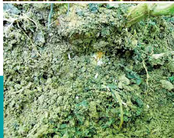
Figura 2. Plantas de chayote ( Sechium edule ) infestadas de larvas de Diabrotica spp.; Larvas de Diabrotica spp., alimentándose de la raíz principal de una planta de chayote del grupo varietal virens levis .