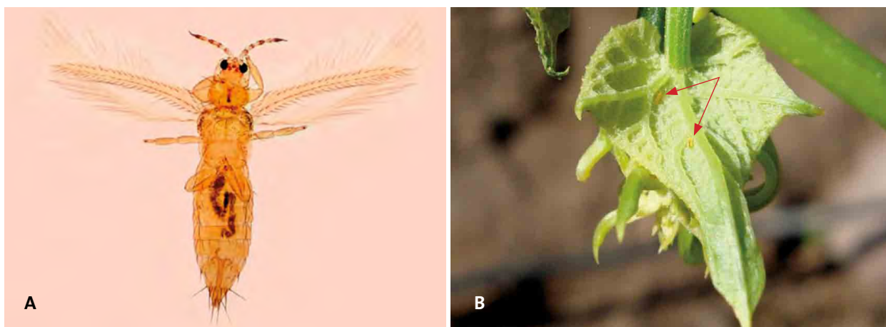
Figura 13. A: Adulto de Frankliniella occidentalis . B: Brotes tiernos de chayote lesionados por el estado adulto de Frankliniella occidentalis .

Control biológico: En huertas comerciales se encuentran, de manera natural, gran cantidad de enemigos naturales que reducen las poblaciones de trips; sin embargo, como método de control biológico por inducción es posible liberar chinches de la familia Anthocoridae, como la chinche pirata ( Orius insidiosus ), con la finalidad de obtener mejores resultados. Algunos miembros del orden Neuróptera pertenecientes a las familias Chrysopidae y Hemerobiidae también ayudan a mantener poblaciones bajas de trips.