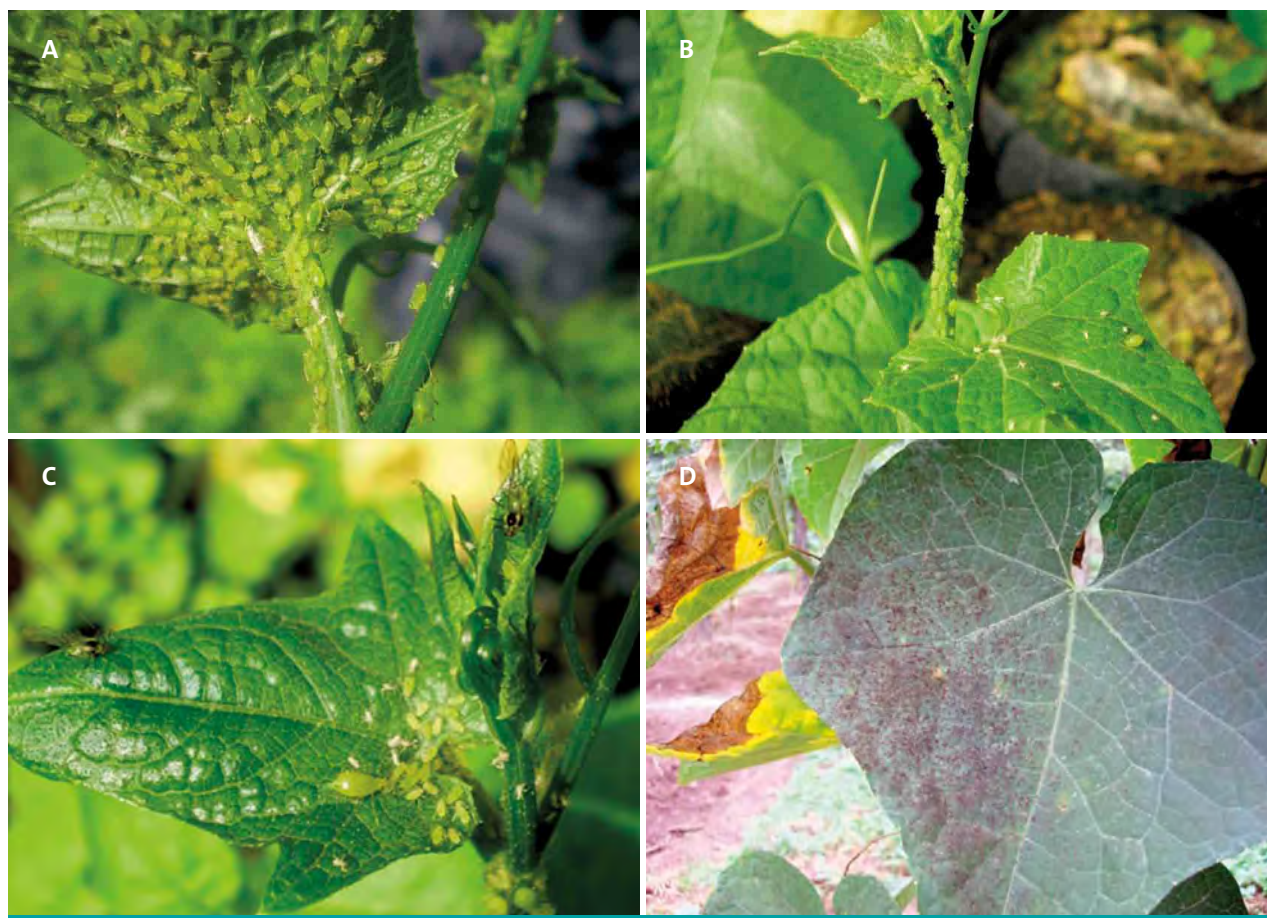
Figura 8. A-B: Colonias de pulgones ( Ropalosiphum maidis ), alimentándose de hojas y brotes tiernos de chayote ( S. edule ). C: Hembras adultas aladas y ápteras. D: Fumaginas sobre hoja de chayote, desarrollándose sobre excretas de pulgón.

Control biológico: En las plantaciones de chayote se encuentran diversos agentes de control biológico que ayudan a disminuir las poblaciones de pulgón, tales como “catarinas”, crisopas (miembros de las familias: Coccinellidae, Chrysopidae, Reduviidae, Aphelinidae, Trichogrammatidae y Braconidae), y algunos otros pequeños que no se perciben a simple vista; sin embargo, se observa su efecto cuando la colonia presenta pulgones inmóviles (momificados) de color café claro, lo cual evidencia que han sido parasitados.