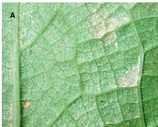
Figura 11. A: Lesiones en hoja causadas por alimentación de ácaros ( Eotetranychus lewisi ). B: Formación de áreas con apariencia de costras en frutos.