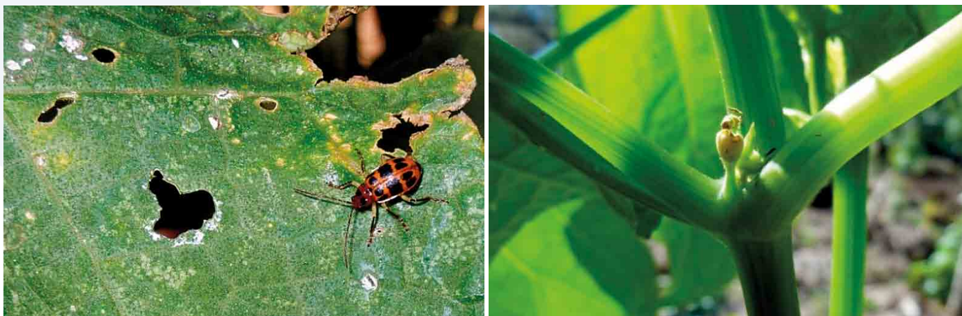
Figura 3. Lesiones en hoja y fruto en desarrollo provocados por el adulto de Diabrotica spp.

las plantaciones bianuales tienen mayor riesgo de ser infestadas. La incorporación de abonos no composteados es un factor importante que influye en la incidencia, ya que se pueden encontrar huevecillos de plagas insectiles.