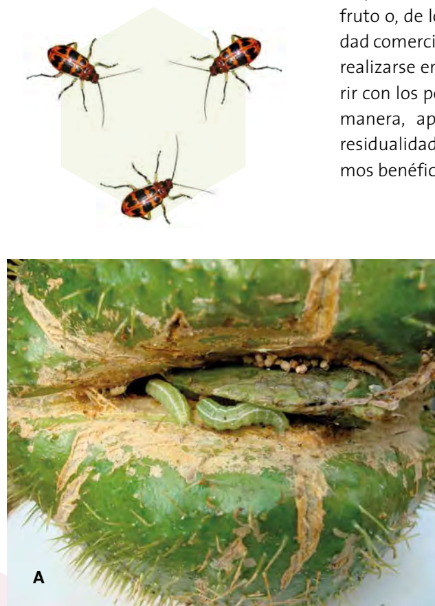
Figura 17. A: Larvas de Diaphania hyalinata , con dos líneas color blanco sobre el dorso. B: Larvas de D. hyalinata , alimentándose de un fruto de chayote verde liso en madurez hortícola.

Control cultural: Eliminar de la plantación todas aquellas frutas barrenadas