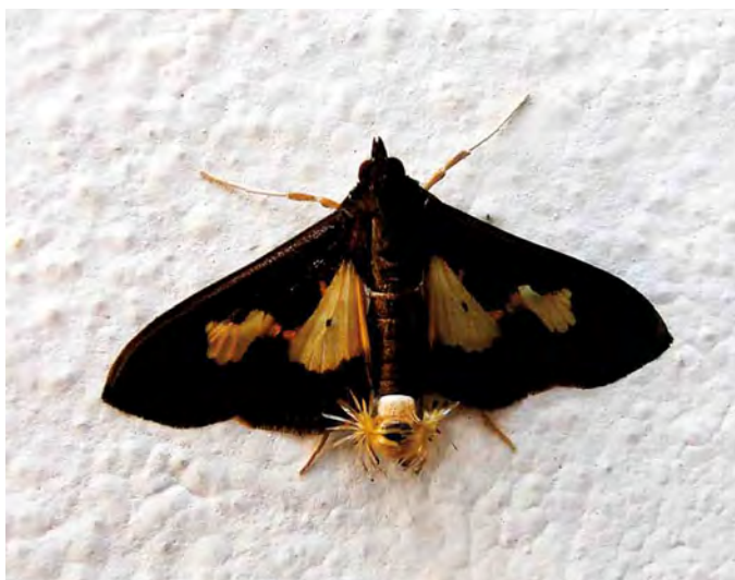
Figura 14. Adulto del barrenador de fruto ( Diaphania nitidalis ) de chayote ( S. edule ).