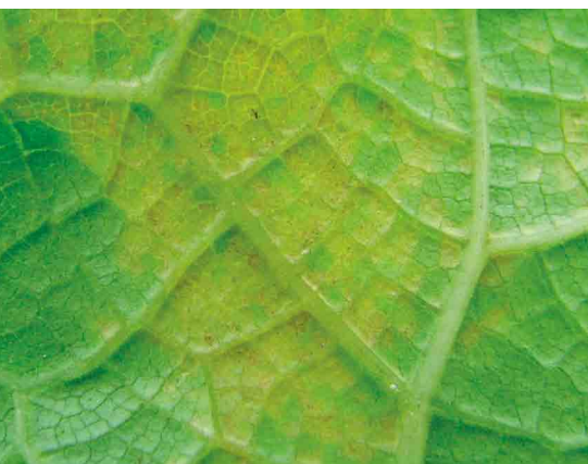
Figura 10. Primeros daños en lámina foliar causados por ácaros.