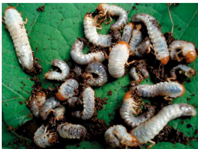
Figura 4. Larvas de "gallina ciega" ( Phyllophaga spp.) atacando plantas de chayote en huertas comerciales

El principal daño se da en estado de larva, ya que se alimentan de las raíces de la planta, provocando estrés por deshidratación. Las hojas presentan coloración amarillenta y consistencia áspera; las guías se observan raquílicas debido a la reducción en la absorción de agua y nutrientes (Figura 6). Estos organismos no se presentan en cada ciclo del cultivo, ya que su ciclo de vida es de uno a dos años; sin embargo, cuando ocurre es en altas densidades de población. Su presencia se aprecia observando si la maleza que