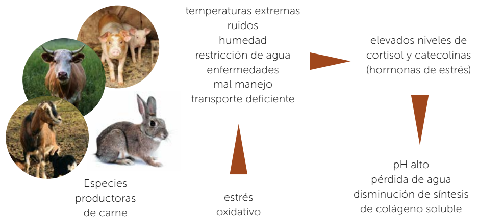
Figura 1. Adaptado de: Falowo (2014), afectaciones del estrés oxidativo en calidad de carne.

En el músculo, los componentes más susceptibles a la oxidación son las grasas y proteínas. La oxidación lipídica ocurre como consecuencia de la absorción de oxígeno en los AGPs libres o esterificados, los cuales generan radicales alquilo y peroxi propiciando la formación de aldehídos, alcanos y dienos conjugados responsables del aroma a "rancio" (Santos-Fandilla et al. , 2014). Aun cuando la oxidación lipídica es considerada la principal causa de deterioro no microbiano, la oxidación de las proteínas de la carne es uno de los temas innovadores en la evaluación de su calidad. De hecho, la oxidación proteica es responsable de muchas modificaciones biológicas, tales como la fragmentación y agregación de proteínas, solubilidad y sobre todo de la oxidación de la principal proteína responsable de la coloración en carne: la mioglobina (Sohaib et al. , 2017). A fin de disminuir las reacciones de oxidación y evitar el uso de compuestos sintéticos, la tendencia de la investigación de la industria cárnica se inclina ha-