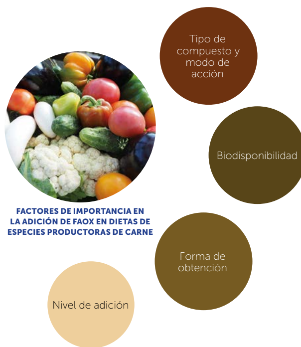
Figura 2. Principales factores que influyen en la utilización de antioxidantes dietarios.

La carne de conejo es altamente apreciada como alimento funcional ya que contiene altos niveles de AGPs (ácidos grasos polinsaturados), esta característica puede causar problemas con el almacenamiento, procesamiento y cocinado ya que los AGPs son altamente susceptibles a la oxidación (Dalle Zotte et al. , 2016). Generalmente el uso de antioxidantes naturales ofrece