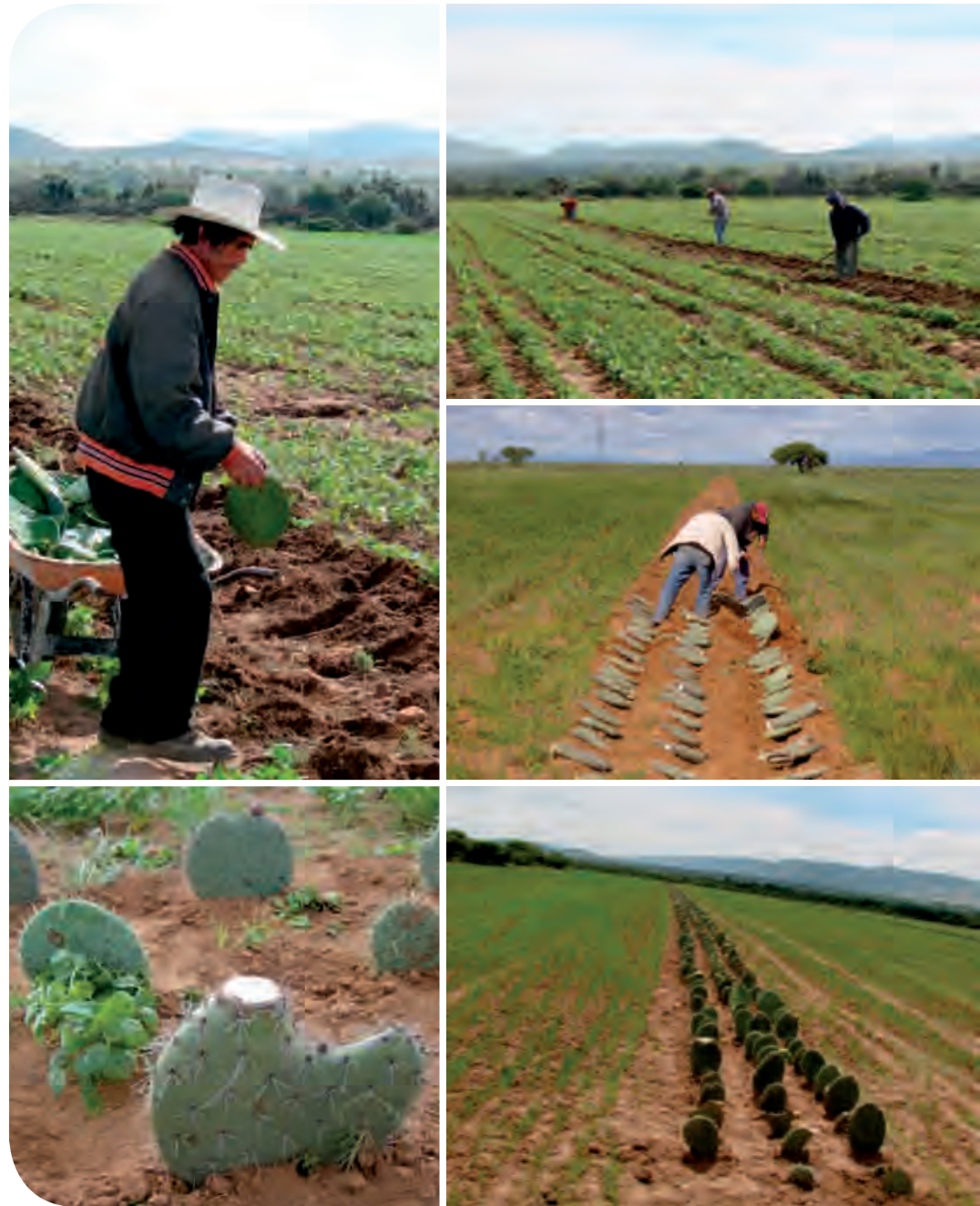
Figura 4. Fases de plantación de nopal para barrera viva distribuido en altas densidades y aprovechamiento de nopal, verdura, tuna y forraje en el Altiplano Potosino-Zacatecano, México.

La siembra de frijol, trigo y/o avena se realiza con sembradoras de labranza de conservación para grano pequeño en forma directa, a las que se les añade un aditamento para la captación del agua (rodillo aqueel), distribuyendo la semilla de manera uniforme con distancia entre hileras de 15 cm (Figura 6), utilizando 60 \text{ kg.ha}^{-1} para frijol y 120\text{-}150 \text{ kg.ha}^{-1} para trigo y avena, colocando las semillas a chorrillo. En lo posible se usa semilla