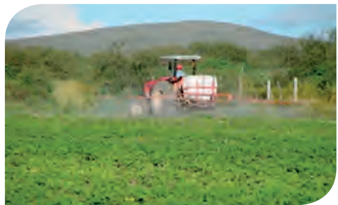
Figura 7. Aplicación de herbicida para control de malezas.