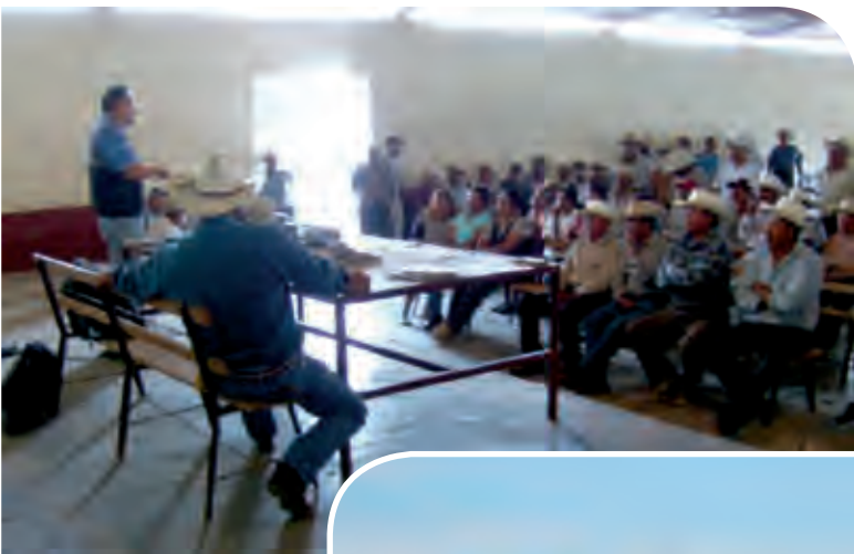
Figura 3. Talleres participativos con actores rurales y panorámica de un predio cultivado en forma tradicional en el Altiplano Potosino-Zacatecano, México.