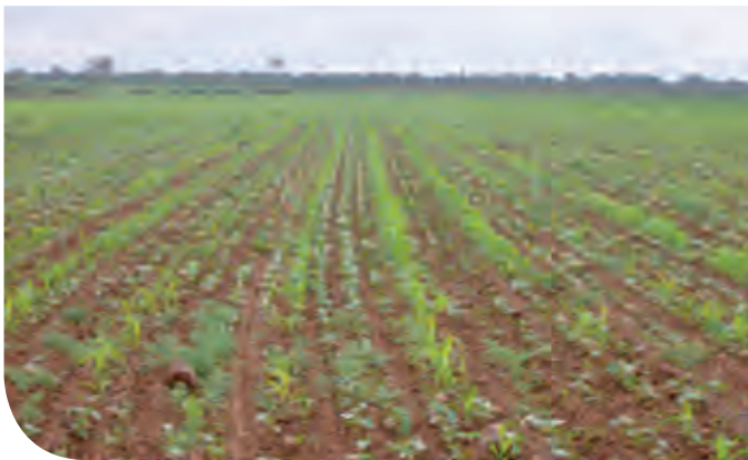
Figura 6. Labranza de conservación con sembradoras para grano pequeño de siembra directa, utilizando el Rodillo Aqueel para captación de agua in situ .