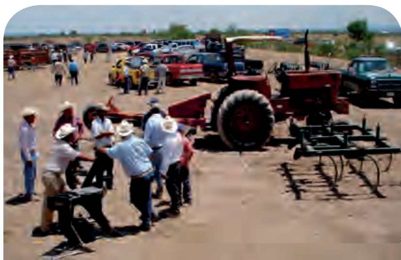
Figura 9. Panorámica de un evento de intercambio de experiencias entre actores rurales insertos en el programa de reconversión productiva.