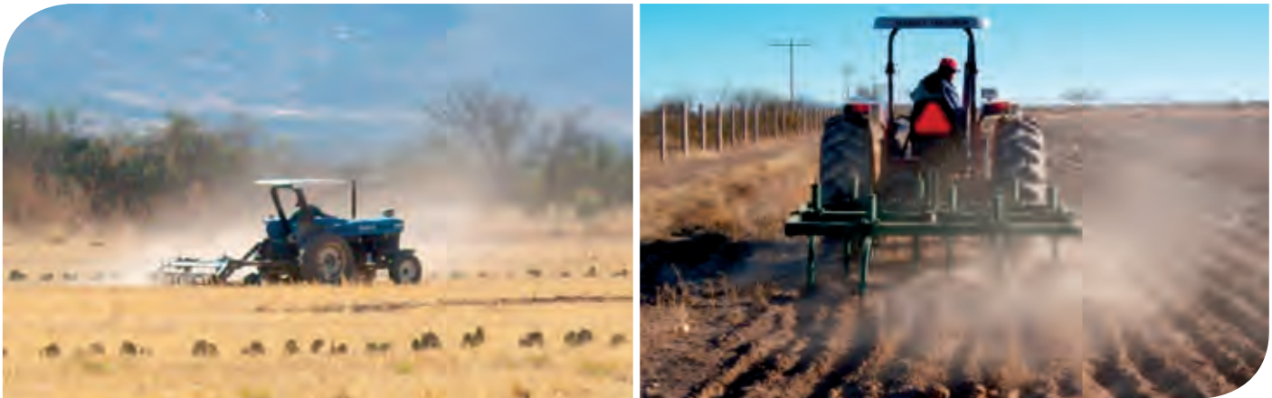
Figura 5. Preparación de terreno con cinceles para labranza de conservación