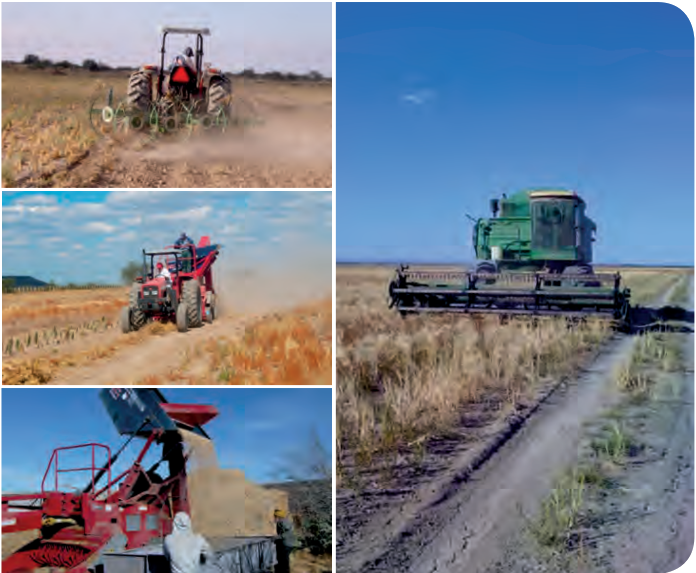
Figura 8. Mecanización de las labores de cosecha.

refleja el buen recibimiento que ha tenido el programa de reconversión y la capacidad de gestoría que han desarrollado los productores asistidos en su totalidad por el Colegio de Postgraduados a través de su Campus San Luis Potosí. La continuidad del proyecto y su sustentabilidad dependerá de la continuidad institucional y organización futura de los productores para gestionar la aplicación de apoyos asistenciales en sus diferentes modalidades, por tratarse de áreas del semidesierto mexicano.