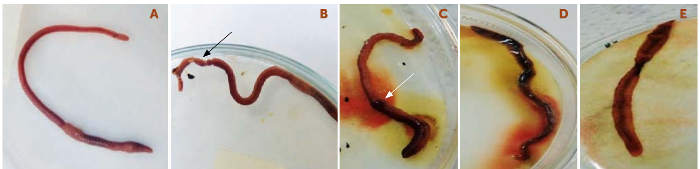
Figura 2. Efectos fisiológicos en Eisenia foetida . Alargamiento de la parte posterior al clitelo ( 100 \text{ mg L}^{-1} en diazinón) (A). Cortes segmentados en la parte posterior de la lombriz ( 400 \text{ mg L}^{-1} en diazinón y endosulfán lactona) (B). Formación de protuberancias después del clitelo y desangrado ( 700 \text{ mg L}^{-1} en endosulfán lactona). Aplanamiento total ( 1000 \text{ mg L}^{-1} en diazinón y endosulfán lactona) (D). Degeneración de la lombriz dejando solo su piel ( 1600 \text{ mg L}^{-1} en diazinón y endosulfán lactona) (E).

La CL50 y CE50 evaluada para la prueba en sustrato artificial, se pueden apreciar en el Cuadro 4 y en la Figura 3. Las concentraciones reportadas se podrían usar como referencia para procesos de remoción en sustrato, haciendo uso de Eisenia foetida . Gupta et al. (2011) sometieron a Eisenia foetida a endosulfán por 96 horas y encontraron una CL50 de 0.002 \text{ mg kg}^{-1} . Por otro lado Wang et al. (2012) sometieron a Eisenia foetida al plaguicida acetoclor por 14 días encontrando una CL50 de 283 \text{ mg kg}^{-1} .