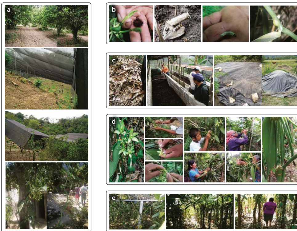
Figura 5. Acciones de manejo para el establecimiento de Vanilla planifolia en la región Huasteca de San Luis Potosí, México. a) Utilización de plantación en cítricos, malla sombras y huertas, b) control biológico, c) elaboración de compostas, d) polinización y fructificación, e) fomento del manejo de plantas.

Se distingue por mover las plantas de vainilla de los sistemas agroforestales hacia sitios controlados o próximos a sus hogares. Se acondiciona un espacio para establecer las plantas nativas de vainilla (procedentes de fragmentos de bosque tropical o del monte) dentro de sus parcelas agrícolas o terrenos cercanos a sus hogares (huertas de naranjo, cafetales, malla sombras, entre otros) (Figura 5). Los agricultores se encargan de desmontar, elaborar terrazas y sembrar algunos tutores. Multiplicar las guías trasplantadas (esqueje: reproducción asexual) para incrementar el número de plantas e iniciar el cultivo de esta especie. Con ánimo de incrementar el conocimiento sobre la orquídea, se consolidó una organización de vainilleros a nivel local, y se da un intercambio de saberes a nivel local, regional, estatal y nacional. Las personas han aprendido a polinizar las flores de manera manual, y fecundan entre 4 y 10 flores por maceta para aumentar el número de frutos a la cosecha. En 2016, a través de la transmisión del conocimiento, se establece el cultivo de vainilla y su control biológico. Existe capacitación técnica para la multiplicación adecuada de esquejes,