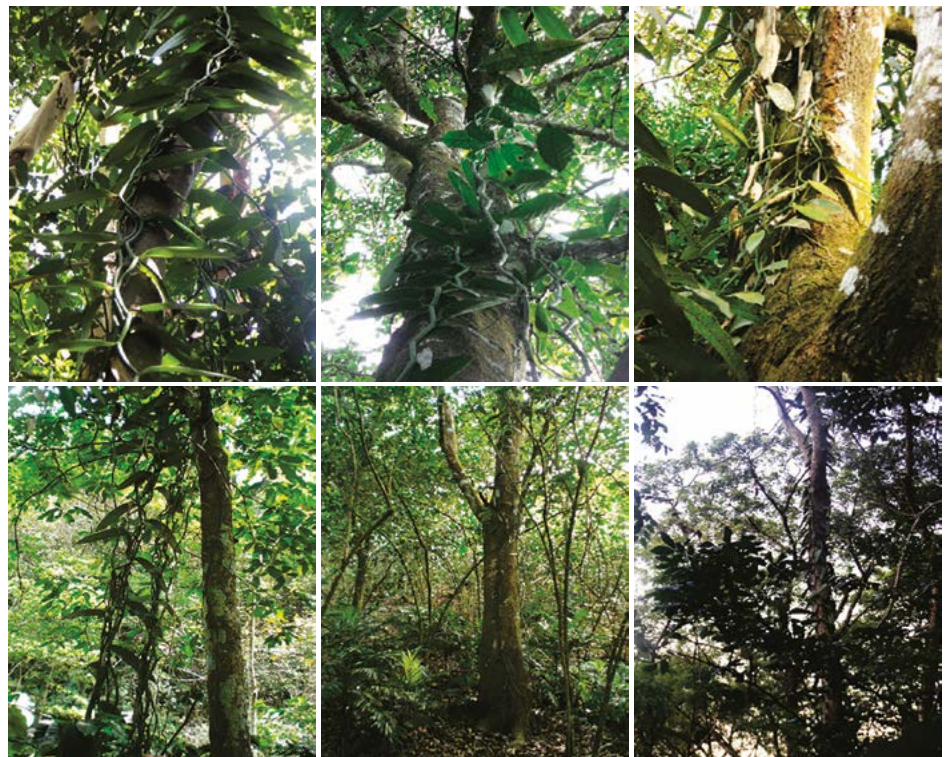
Figura 3. Tolerancia de guías de Vanilla planifolia en sistemas agroforestales de la región Huasteca de San Luis Potosí, México.

ción ejercida durante visitas constantes a sus terrenos. Su esfuerzo se dirige a proteger y conocer el ciclo biológico de esta planta; así como a cosechar el mayor nú-