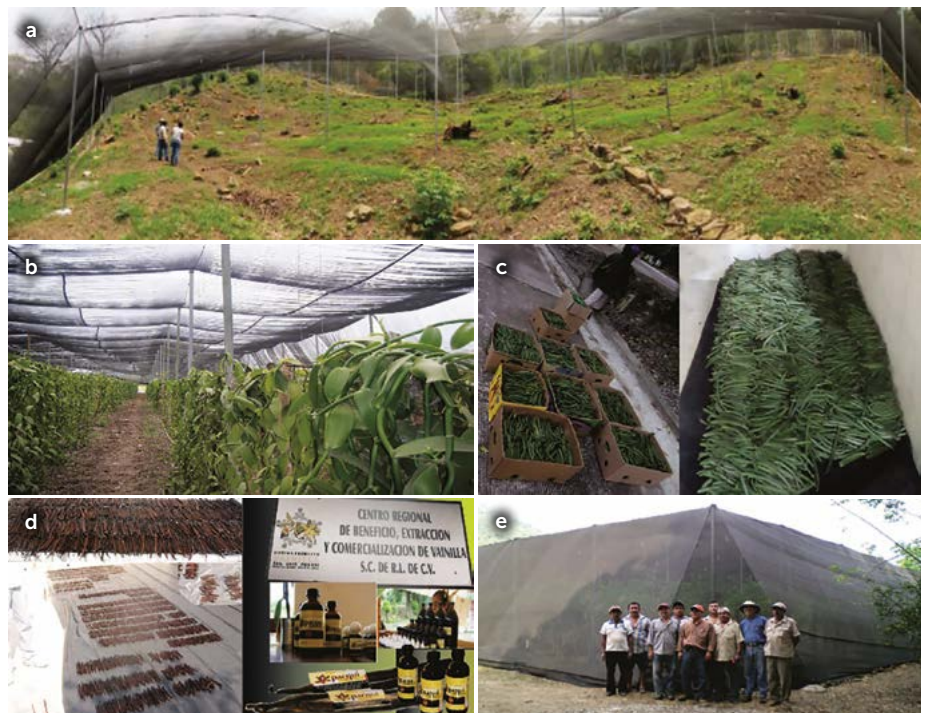
Figura 6. Propagación de plantas de Vanilla planifolia en la región Huasteca de San Luis Potosí, México. a) Superficie de cultivo, b) Sistema de cultivo (malla sombra), c) recepción y acopio del fruto, d) Beneficiado del fruto y elaboración de productos, e) sistema de organización social.

Con base en el conocimiento tradicional y en la intensidad del trabajo sobre el germoplasma de vainilla, se reconocieron las etapas de manejo de 1) recolección, 2) tolerancia, 3) protección e inducción, 4) trasplante y fomento de esquejes, y 5) siembra y plantación, que tienen los pobladores de la región Huasteca en San Luis Potosí, México. La intensidad de manejo está asociada a tres aspectos: 1) la orografía y fisonomía del terreno donde se encuentran las plantas, 2) a las condiciones sociales y aspectos ecológicos de la región, y 3) a las actividades agrícolas vinculadas con el uso del suelo y a la disponibilidad del capital humano, social y económico de las comunidades de la región.