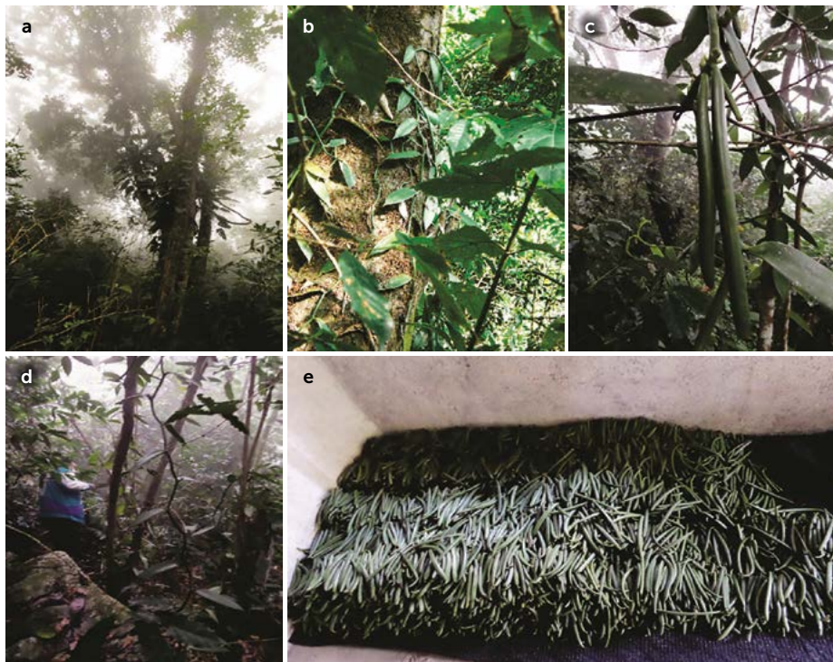
Figura 2. Recolección de frutos de Vanilla planifolia en la Huasteca potosina, México. a) Hábitat, b) crecimiento de guías, c) fructificación, d) recolección, e) acopio de frutos.

encuentran en una gran abundancia. La polinización es de manera natural. La mayor parte de los frutos se benefician en la planta, y al desprender su aroma, las personas cortan el fruto para utilizarlos en bebidas alcohólicas y atoles. Algunos otros frutos son cortados en verde y se comercializan a acopiadores locales. Su corte es incómodo y laborioso debido a las características del terreno, al tamaño de las guías y a la altura de la ubicación de los frutos; por lo que esta actividad se realiza de manera familiar. En esta etapa, las personas reconocen el período de floración, el tiempo de crecimiento de las silicuas y su fecha de cosecha.