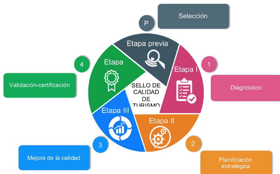
Figura 2. Etapas para la obtención de sellos de calidad.

La etapa de selección, comprende los siguientes pasos: i) Solicitud y firma de carta compromiso donde se dan a conocer los derechos y obligaciones de la organización y sus miembros. ii) Se establecen los requisitos legales y organizacionales, tales como acta constitutiva, registro de la Secretaria de Hacienda, inscrito en el Registro Nacional de Turismo, tener una antigüedad de dos años, estar catalogado como comunidad rural y contar con una clave de municipio. iii) Conformar un comité interno de selección, el cual estará encargado de la aplicación y seguimiento de la certificación para garantizar la adecuada implementación del proceso.