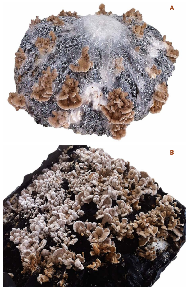
Figura 2. Morfología de los basidiomas de S. commune cultivados en cáscara de cacao: A) conados y B) flabeliformes (Fotografías: Santa D. Carreño Ruiz).

Schizophyllum commune se desarrolla y fructifica en condiciones de alta temperatura y humedad, por lo que es un recurso viable para la producción de alimento en la región del trópico húmedo de México. Su crecimiento es rápido, se logra su primera cosecha incluso a los 4 d después del periodo de incubación, apto para producirse en