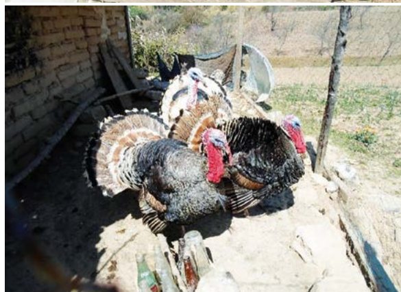
Figura 3. Características de las instalaciones utilizadas como corrales en la avicultura de traspatio en comunidades rurales de Campeche, México.