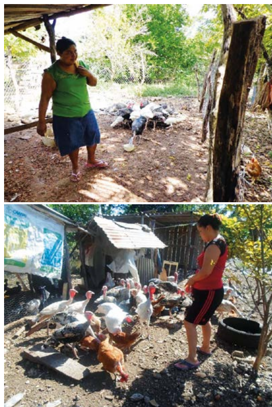
Figura 1. Participación de la mujer en la crianza y manejo del guajolote nativo ( Meleagris gallopavo ) en el centro-sur de Campeche, México.

La comercialización del guajolote se realiza en la misma comunidad (40.8%) y el resto lo venden a restaurantes de la Ciudad de Campeche (40.4%) que lo ofrecen como un platillo preferente (relleno negro o mole de guajolote). El animal sacrificado sirve de complemento a la dieta de la familia, constituidas de 4 a 6 integrantes (56.2%), situación similar a lo informado por Canul et al. (2011) en Yucatán, México. Es común el intercambio de pie de cría en forma remunerada entre familias y vecinos, lo que sugiere aumento de la endocría, con efectos desfavorables en la reproducción.