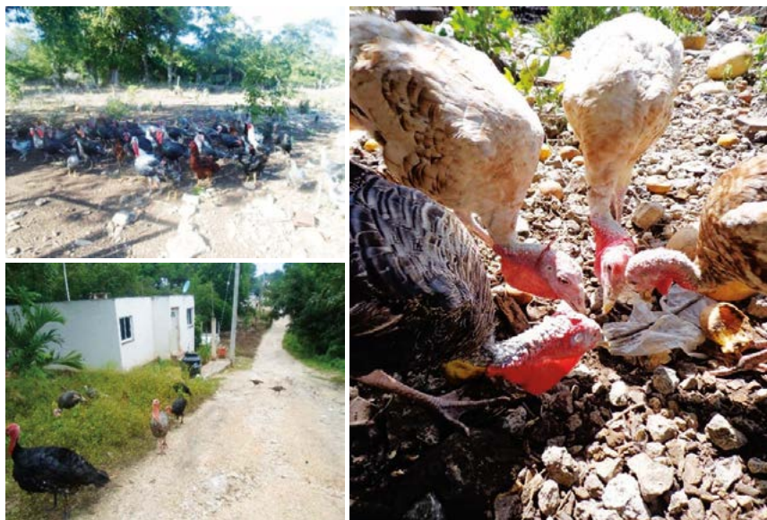
Figura 2. El pastoreo como alternativa de alimentación de guajolotes nativos ( Meleagris gallopavo ) en la región centro-sur de Campeche, México.

La alimentación del guajolote se basa en los insumos que disponen los traspatios, además de lo que el animal cosecha en pastoreo, variando su dieta con la edad. El maíz en grano ( Zea mays L.) se proporciona a guajolotes adultos (62.5%), además de masa de maíz, salvadillo y desperdicios de cocina (tortilla, pan, frutas y verduras) (31.2%). Para pavipollos en sus primeras etapas de crecimiento se utiliza alimento comercial (95.6%) el cual disminuye su mortalidad. Durante el pastoreo, los guajolotes consumen hierbas, pastos, gusanos e insectos que recogen directamente del suelo (Figura 2); con esta práctica se favorece la aportación de proteína a la dieta de los animales (Tovar-Paredes et al. , 2015), además de que no genera problemas de enfermedades debido a la resistencia y adaptación de estas aves a condiciones lo-