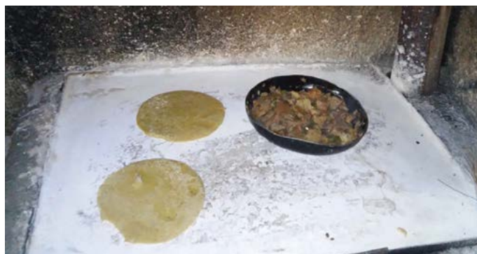
Figura 3. Hongos clavito ( Chjoobootaa ) cocinados al vapor con ajo, cebolla y hierbabuena (Guzmán-Márquez, 2019).

Los platillos característicos en los que el hongo se utiliza como principal ingrediente son el caldo de hongos ( chichjoogui ) donde se combinan las once variedades con cebolla, sal, chiles y hierbas de olor, el mole rojo con hongos ( chimi choogui ) (Figura 3). En esta preparación se utilizan seis tipos de hongos secos combinados con cebolla, especias y otros ingredientes dulces y salados, el tamal de hongos ( tjechoogui ) combinando masa de maíz amarillo, manteca de cerdo y cebolla, también quesadillas ( jmechojoogui ) (Granados y Pérez, 2012).