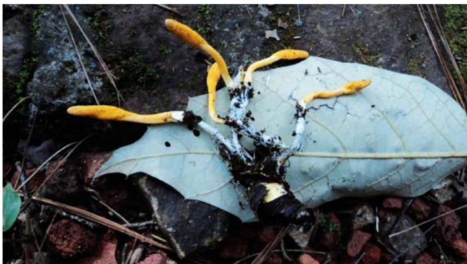
Figura 3. Estroma del hongo silvestre Cordyceps sp., colectado en Tenancingo, Estado de México (López, 2017).

empírico sobre el recurso fúngico (Martínez et al. , 2005). De acuerdo con esta premisa, y con respecto a los hongos entomopatógenos y micoparásitos del grupo Cordyceps s.l., la especie con potencial como alimento funcional para ser aprovechado en México es T. ophioglossoides . Por tanto, también es importante realizar investigaciones etnomicológicas, dirigidas a conocer el uso que dan los pobladores a estas especies, ya que como se mostró a lo largo del escrito, la mayoría de las especies muestran alto potencial en la producción de fármacos con propiedades anticancerígenas, antioxidantes y antibióticas, primordialmente.