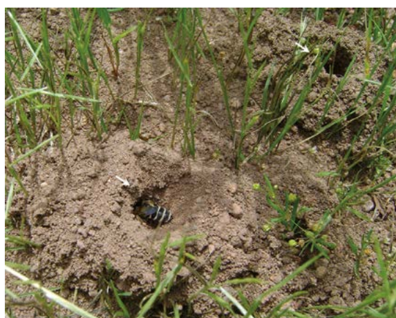
Figura 3. Hembra del género Hesperapis (familia Melittidae) entrando a un nido (Arizona, EU). Estas abejas construyen agregaciones de nidos en el suelo (flechas), pero cada hembra vive sola en un nido.

esperan a las hembras en las flores o cerca de los nidos para aparearse, y en muchas especies tienen menor longevidad que las hembras, pues tienden a morir una vez que se aparean. Las abejas solitarias construyen sus nidos en el suelo, en