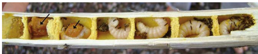
Figura 4. Nido de Xylocopa sp. (Apidae) en una inflorescencia de Agave sp., (Arizona, EU). Las flechas señalan la provisión de polen para cada larva. A la derecha, están las celdas con las larvas más desarrolladas; los puntos negros son heces de larva.

solitario (característica que apareció primero en las abejas) a la sociabilidad en sentido estricto. Relacionado con el hábito solitario, la mayoría de