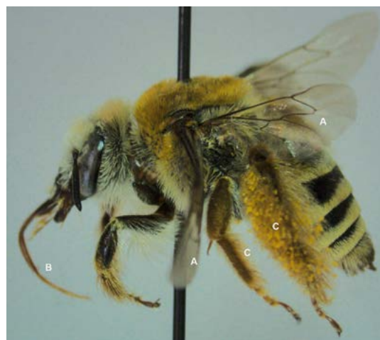
Figura 1. Abeja del género Diadasia (Familia Apidae) recolectada en Sierra de Huautla, Morelos, México. Alas membranosas (A), las estructuras bucales (B) y las escopas (C). Es notable la pubescencia (zonas de quetas o pelos) en gran parte del cuerpo de la abeja, y el polen recolectado en la escopa de la pata trasera.

La abeja más conocida es la abeja mielera ( Apis mellifera L.) traída a América durante la época colonial para la producción de miel y productos, tales como el propóleo y jalea real. Actualmente, su manejo está muy extendido, y se encuentra naturalizada en prácticamente todas las regiones geográficas. Esta abeja vive en colonias perennes, conformadas por una reina que se encarga de la reproducción, mientras que las obreras, infértiles, buscan el alimento y cuidan a las larvas; a esta repartición de las tareas se le llama división de labores. Además de A. mellifera , abejas de los géneros Melipona y Scaptotrigona , originarias de Mesoamérica, forman