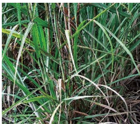
Figura 2. Aspecto zacatoso de la cepa contaminada por las esporas del carbón de la caña de azúcar.

Colecta de esporas. Se recorrieron lotes cultivados con el clon NCo 310 (altamente susceptible), para coleccionar látigos y obtener las esporas del carbón. Los látigos fueron desprovistos de hojas, vainas, parte basal y apical, posteriormente se inició el proceso de obtención de las teliosporas, el cual consistió en el secado de los látigos por 5 d a temperatura de 35 °C, la cual permitió la separación y liberación de esporas de las estructuras parenquimatosas.