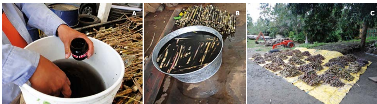
Figura 3. Proceso de inoculación. Inóculo (A), Inoculación (B) e Incubación (C).

Variables evaluadas. En ambos métodos las evaluaciones fueron cuantitativas, a los 4 y 7 meses de edad de los tallos, en los ciclos planta y soca. Se consideró el total de tallos (sanos y enfermos), en los 20 m lineales en el método de infección natural y en los 84 m de longitud del surco en el método de infección por inoculación. Se determinó la severidad para ambos métodos, mediante el porcentaje de infección, el cual se obtuvo, al dividir el número de tallos enfermos entre número de tallos sanos y multiplicar por 100, se utilizó la escala de severidad propuesta por Young-Kong (1976), la cual se muestra en el Cuadro 2.