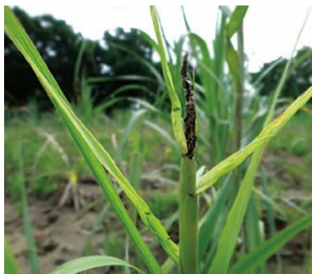
Figura 1. Meristemo transformado por el hongo.

Información climatológica. Se registraron los datos de temperatura (máxima y mínima) y humedad relativa, durante el período de evaluación de la enfermedad, y se analizaron para determinar la presencia de la enfermedad en campo.