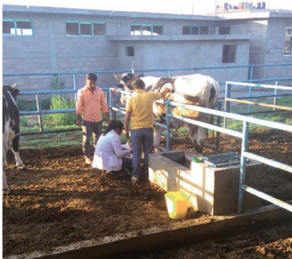
Figura 1. Obtención de líquido ruminal fresco de un bovino con cánula permanente. Previamente en el laboratorio se llena un termo con agua destilada a 39 °C. Justo antes de realizar la colecta, el agua del termo se desecha y se coloca el líquido ruminal filtrado con tela tipo gasa dentro del termo. Una vez obtenida la cantidad deseada, se cierra el termo y se transporta inmediatamente al laboratorio para la preparación del inóculo.

la actividad microbiana (Rymer et al. , 2005). Por esa misma época, Tilley y Terry (1963) realizaron estudios in vitro para medir la degradación de sustratos a un punto fijo, pero fue en 1975 cuando Czerkawski y Breckenridge desarrollaron un sistema de desplazamiento de un émbolo por efecto del gas producido en fermentaciones realizadas en una jeringa de vidrio. Posteriormente, en 1979, Menke y colaboradores utilizaron la técnica con jeringas para determinar la fermentación a punto final después de 24 horas de incubación. Esta técnica fue modificada por Blümel y Orskov en 1993 incubando las jeringas en una incubadora rotatoria, estableciendo que si se registraba la producción de gas a intervalos frecuentes se podía determinar la cinética de la fermentación. En lugar de registrar el desplazamiento de un émbolo, también se puede medir la presión de gas, metodología descrita