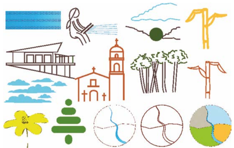
Figura 2. Imágenes representativas del territorio de San Francisco Oxtotilpan, Estado de México.

Crear una marca territorial requiere de un proceso colectivo de conformación de símbolos para la materialización de una identidad local que permita distinguir el ellos