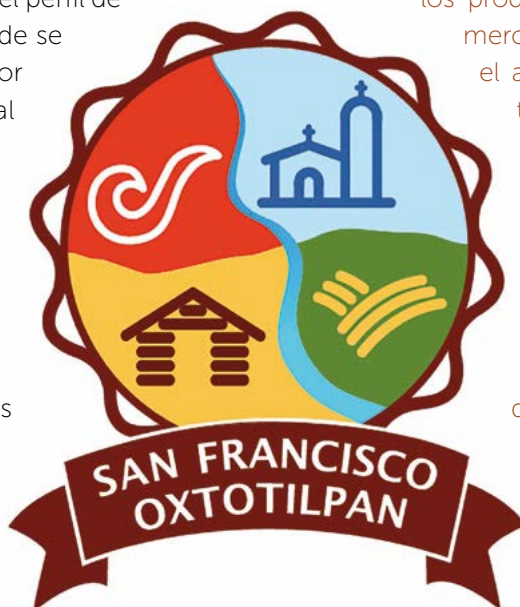
Figura 3. Propuesta final para la Marca Territorial de San Francisco Oxtotilpan, Estado de México.

Los resultados de esta investigación pueden ser de utilidad para los habitantes de la comunidad de San Fran-