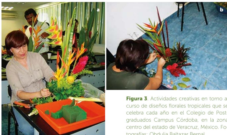
Figura 3. Actividades creativas en torno al curso de diseños florales tropicales que se celebra cada año en el Colegio de Postgraduados Campus Córdoba, en la zona centro del estado de Veracruz, México.

En el estudio se encontraron 28 especies de ornamentales donde la gran mayoría tiene más de 10 días de vida de florero, lo que las hace muy atractivas como flores de corte. Las flores pueden ser muy redituables si se comercializan como diseños florales. Los municipios de la zona centro del estado de Veracruz pueden aprovechar los recursos florísticos con la venta de flores, el turismo rural y con experiencias únicas que