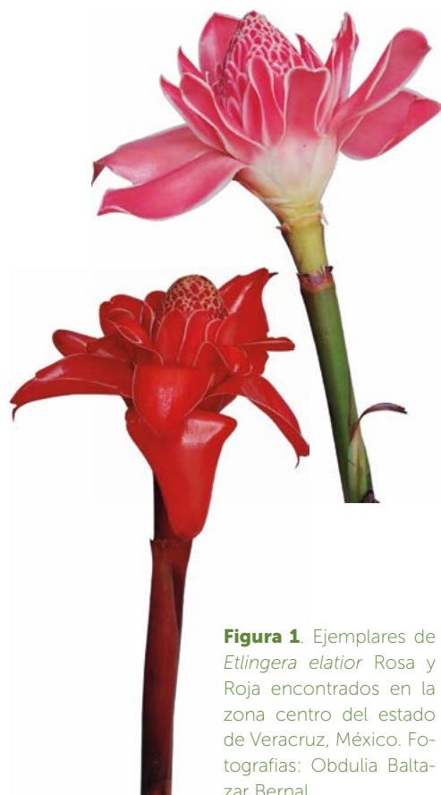
Figura 1. Ejemplares de Etlingera elatior Rosa y Roja encontrados en la zona centro del estado de Veracruz, México.

Es importante resaltar que la floricultura sustentable tiene un gran potencial turístico en la zona centro del estado de Veracruz. Por ello se considera que para que la producción de flores sea más rentable económicamente, es pertinente capacitarse en el manejo postcosecha y en el diseño floral. Por eso, en el Colegio de Postgraduados Campus Córdoba se ofrece un curso de capacitación para apoyar a los floricultores en la generación de valor agregado. El curso incluye la realización de diseños florales, además, se hace hincapié en aprovechar los materiales tropicales, en la búsqueda de alternativas para