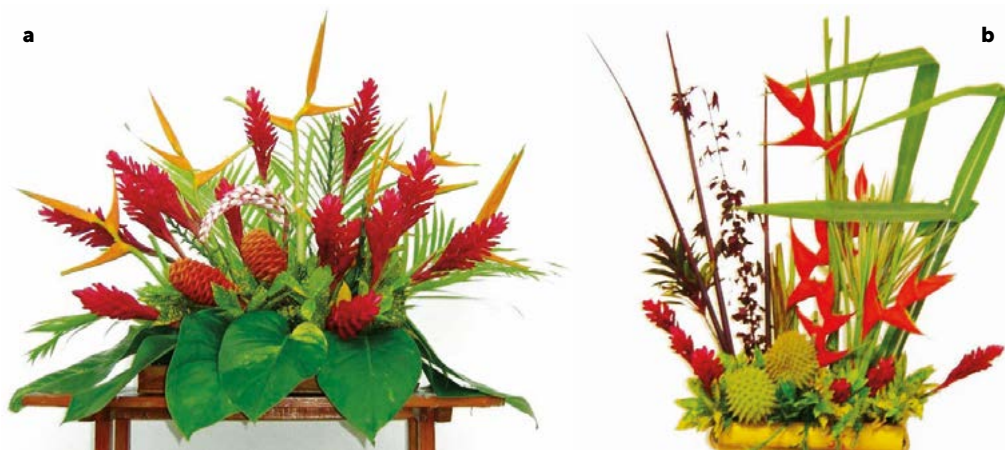
Figura 4. Diseños florales que utilizan especies ornamentales producidas en la zona centro del estado de Veracruz, México. a. Arreglo Tropical; b. Arreglo con Follajes Tropicales.

por un lado, promuevan el conocimiento de las flores tropicales y a la vez, posibiliten experiencias únicas en sus visitantes. Por ello, la floricultura tropical es un excelente complemento del turismo rural, además de una fuente adicional de ingresos económicos en el medio.