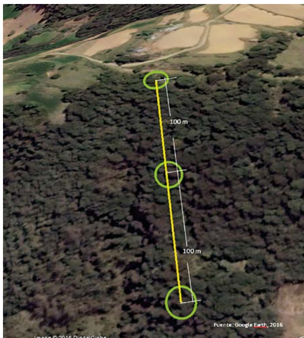
Figura 2. Ejemplo de transecto del muestreo del área afectada por el secamiento de las acículas y caída foliar de pino en Ayocuantla en Aquixtla, Puebla, México.

Se utilizaron bases de datos de 2011 a 2014 de estaciones meteorológicas automatizadas cercanas al área de estudio, de los estados de Hidalgo, Puebla, Tlaxcala y Veracruz, proporcionadas por el Sistema Meteorológico Nacional y la Comisión Nacional del Agua. Posteriormente se depuraron y analizaron para procesarlas en valores de temperatura promedio, máxima y mínima, precipitación acumulada y humedad relativa promedio, a nivel anual. Los valores se procesaron en el software ArcMap 10.3™ con el sistema de coordenadas UTM y Datum WGS84; y con ello se efectuó la interpolación de los datos en formato raster. El método de interpolación utilizado fue el IDW recomendado por Kravchenko (2003) para bases de datos pequeñas en donde los parámetros del variograma no son conocidos, cuando la distancia de muestreo es muy grande e incluso para cuando la distancia de muestreo es mayor al rango de correlación espacial.